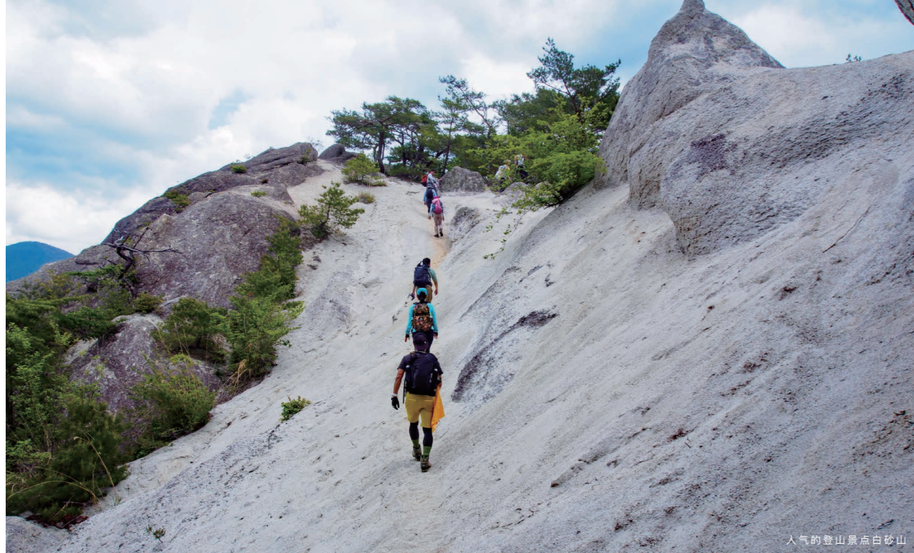
人气的登山景点白砂山