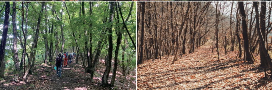
1 | 金峰山顶的五丈岩 2 | 夏季的御岳古道 3 | 冬季的御岳古道