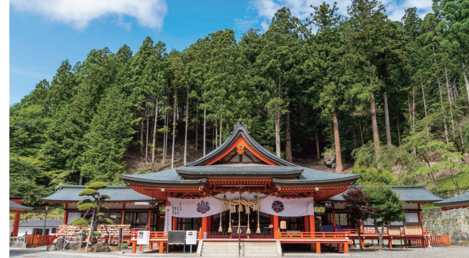
1 | 金樱神社的前殿 2 | 用水晶做的御朱印盖章（御朱印可作为参拜寺院或神社的证明，御朱印费用：300日元） 3 | 金樱神社内的杉树

金 樱神社是以金峰山的五丈岩为神体的神社。曾经有广阔的领地，其中大部分是森林。神社比较重视对森林的培育。此外，近年来金樱神社还因为能提升财运而备受关注。