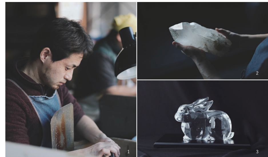
1 | 作坊里现在也做着水晶制品 2 | 加工前的水晶 3 | 通过研磨水晶来完成雕刻

江 户时代以后，人们开始在金峰山的山麓进行水晶开采，周边的村庄也开始了水晶加工。甲州传统的水晶加工技术一直传承至今，现在也在坚持用传统工艺制作产品。