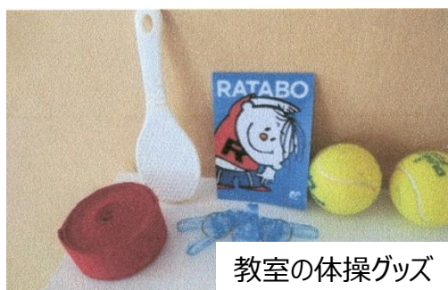
教室の体操グッズ