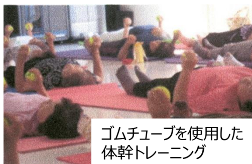
ゴムチューブを使用した体幹トレーニング