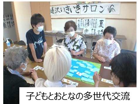
子どもとおとなの多世代交流