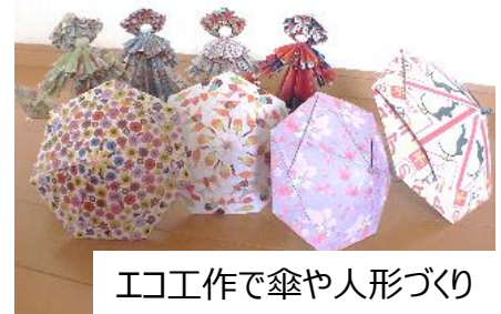
エコ工作で傘や人形づくり