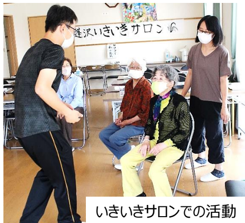
いきいきサロンでの活動