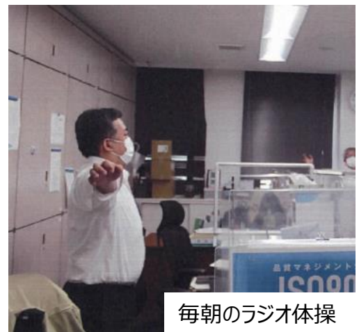
毎朝のラジオ体操