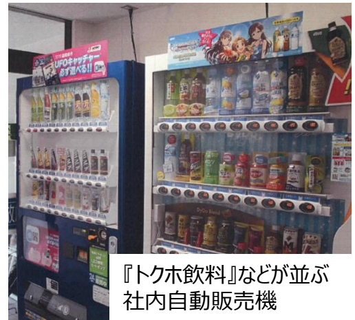
『トクホ飲料』などが並ぶ社内自動販売機