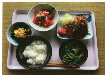
健康メニューの提供

健康づくりの一環として山梨県・山梨学院大学・山梨学院短期大学連携事業が作成した「やまなししぼルトメニュー」を本社食堂でもとりいれました。