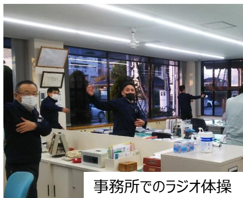
事務所でのラジオ体操