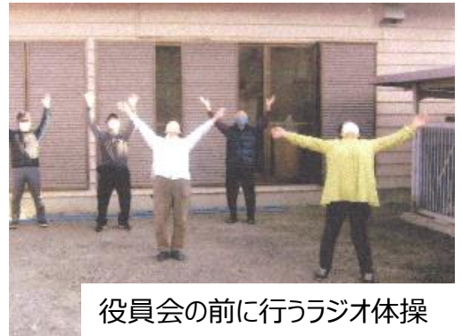
役員会の前に行うラジオ体操