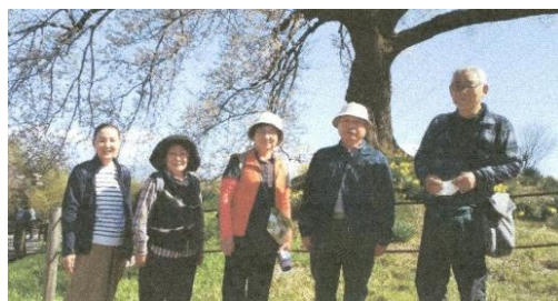
現地での記念撮影