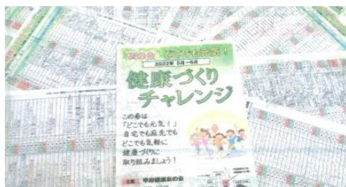
参加者の取組の記録