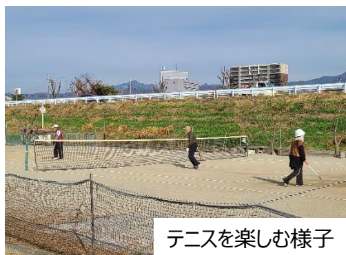
テニスを楽しむ様子