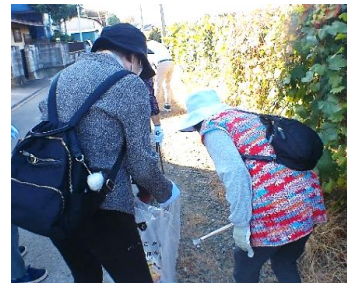
多地域の方と協力しての清掃活動