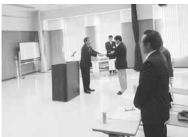
推進員委嘱状交付式の様子