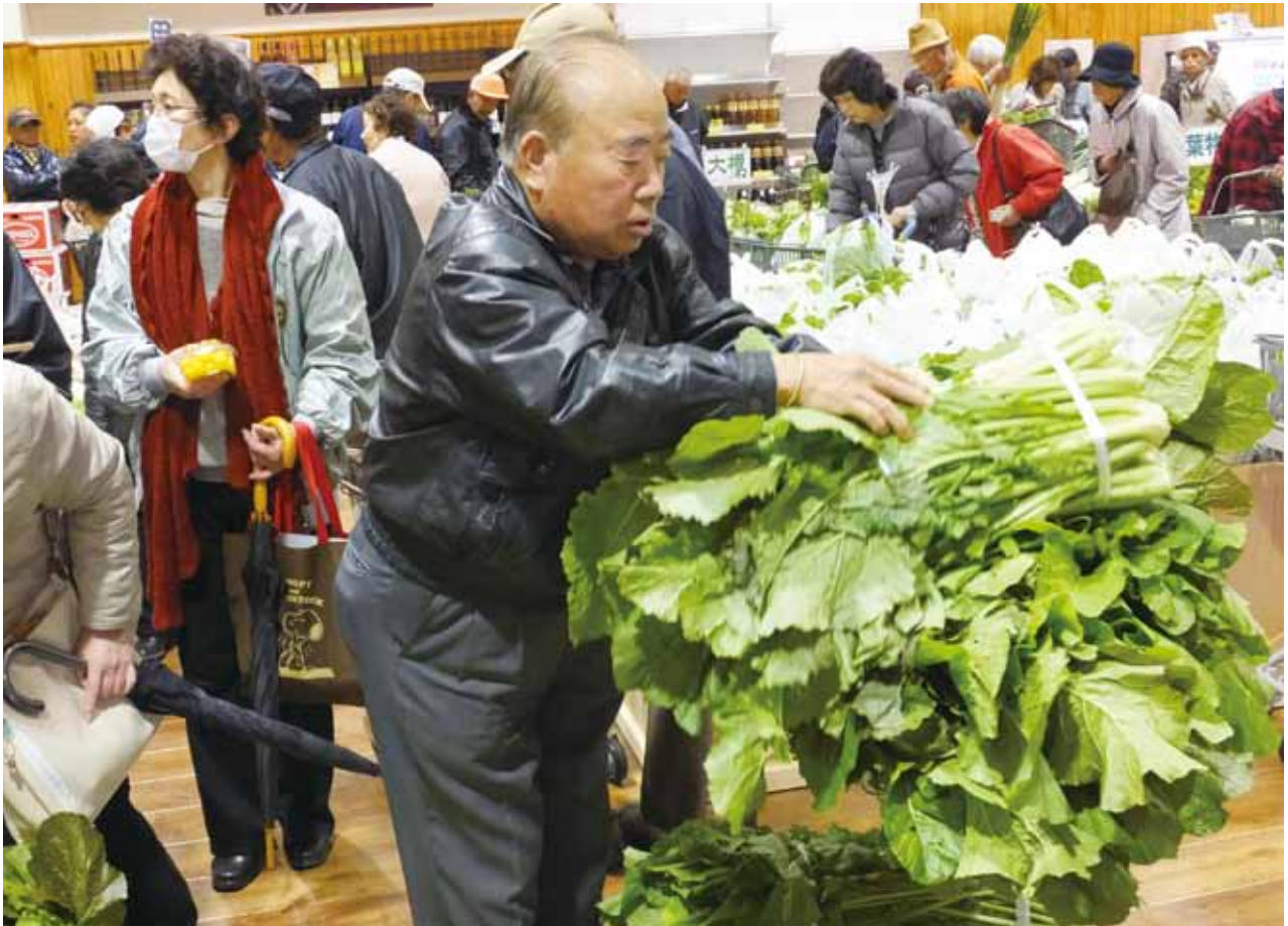
風土記の丘農産物直売所新装オープン

発行 甲府市農業委員会 住所 〒400-8585 山梨県甲府市丸の内一丁目18番1号 電話 055-237-1161(内線7344) 055-237-5892(直通) 編集 甲府市農業委員会だより 編集委員会