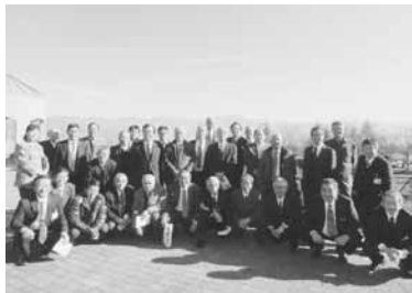
長野県伊那市視察

伊那市は昨年5月に農林水産大臣表彰を受賞しており、その活動が評価された「地域一体となった遊休農地の大規模再生」及び「人・農地プラン」での農地集積、有効活用、担い手の育成などの各事例について研修をしてまいりました。