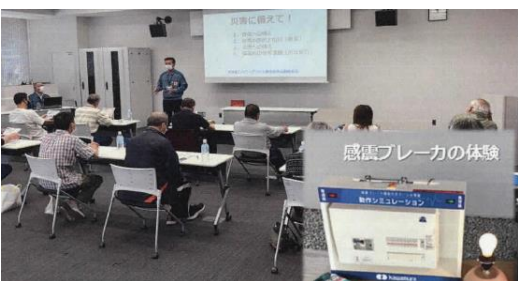
防災リーダー研修会の様子▲