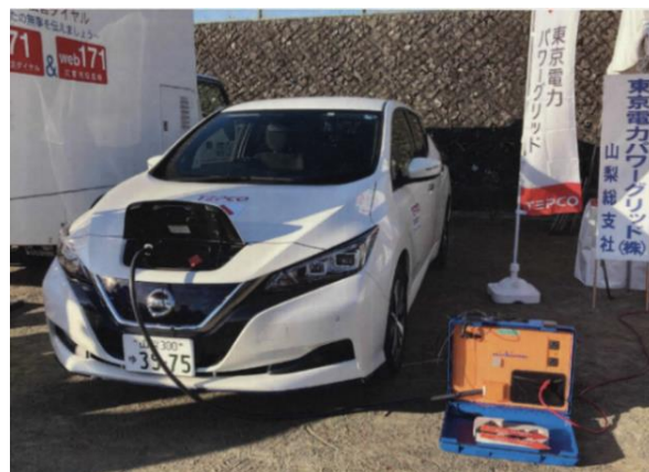
▲電気自動車から電気を供給する様子

* 災害時に備えた電気知識の研修会をお住いの地域に出向いて開催します。 希望される場合は、甲府市協働支援センター (☎055-231-5537) までご連絡ください。