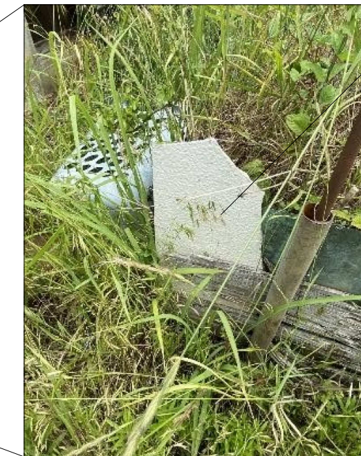
石綿含有建材(スレート板)