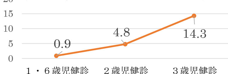
甲府市の幼児健診におけるむし歯の保有率