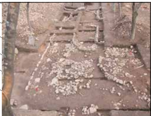
上段建物跡 (発掘調査時)