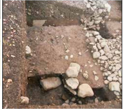
中・下段区画段差門跡 (発掘調査時)