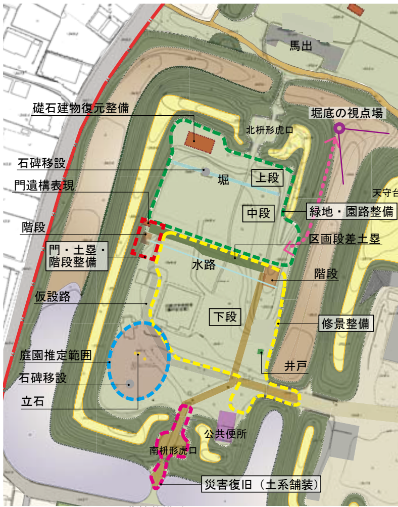
西曲輪整備計画図 S=1:1500