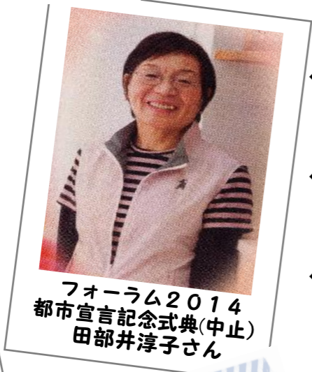
フォーラム2014 都市宣言記念式典(中止) 田部井淳子さん