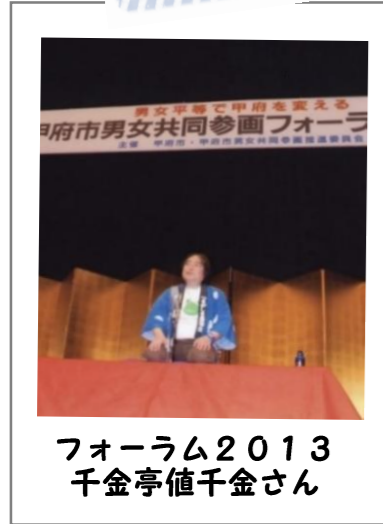
フォーラム2013 千金亭値千金さん