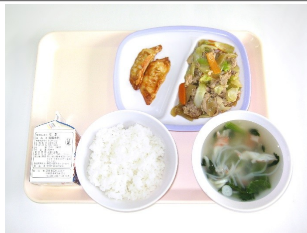
9月12日(火) ご飯・春雨スープ・豚肉と野菜の生姜炒め 揚げぎょうざ