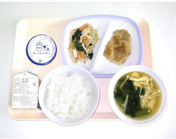
9月22日(金) ご飯・わかめの味噌汁・揚げ魚の黒コショウソース 切り干し大根のナムル・ミルクプリン