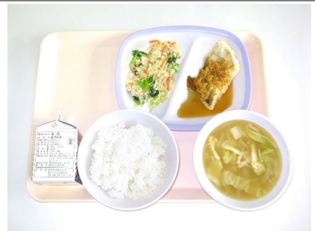
9月13日(水) ご飯・白菜の味噌汁・白身魚の香味ソース 野菜のそぼろ炒め