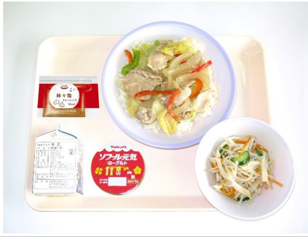
9月19日(火) ねぎ塩豚丼・棒々鶏風サラダ・ヨーグルト