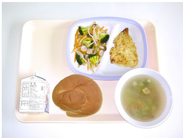
9月28日(木) ミルクパン・ペイザンヌスープ 鶏肉のパン粉焼き・もやしのソテー