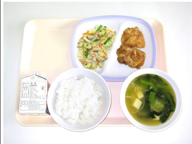
9月15日(金) ご飯・豆腐の味噌汁・鶏のから揚げ・ビーフン炒め