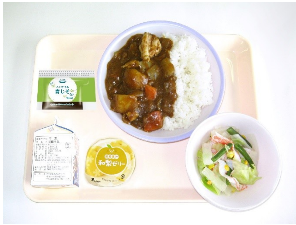
9月25日(月) チキンカレー・和風サラダ・和梨ゼリー