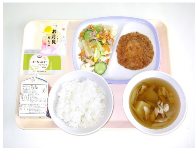
9月29日(金)～十五夜給食～ ご飯・芋煮汁・ピザソースカツ コールスローサラダ・お月見だんご