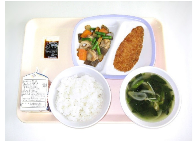
9月27日(水) ご飯・玉ねぎの味噌汁・サーモンフライ いりどり