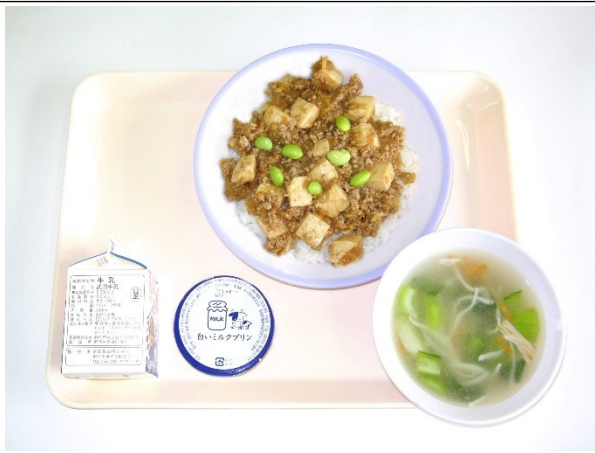
9月11日(月) マーボー豆腐丼・チンゲンサイのスープ ミルクプリン