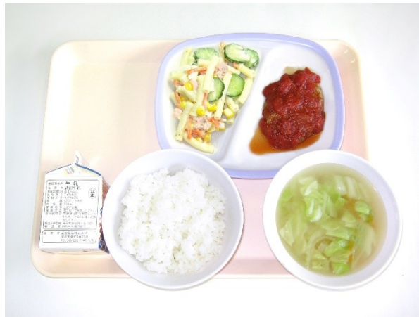
9月26日(火) ご飯・キャベツのスープ 豆腐ハンバーグのトマトソース・マカロニサラダ