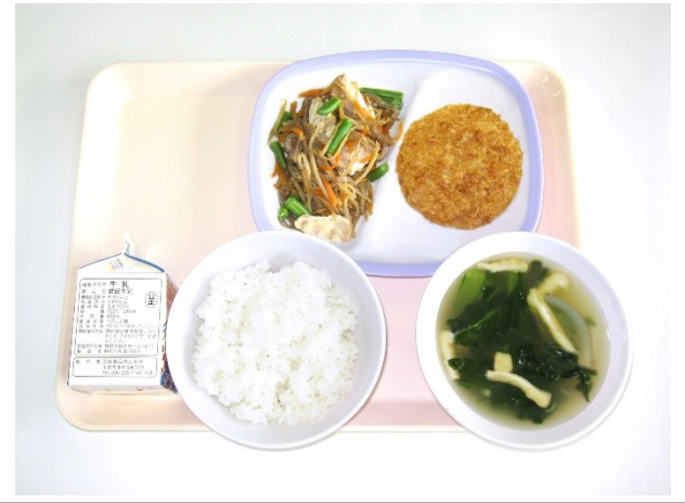
9月20日(水) ご飯・小松菜の味噌汁・ハムカツ・五目きんぴら