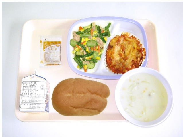
9月14日(木) アーチパン・コーンスープ・ミートグラタン ツナコーンサラダ