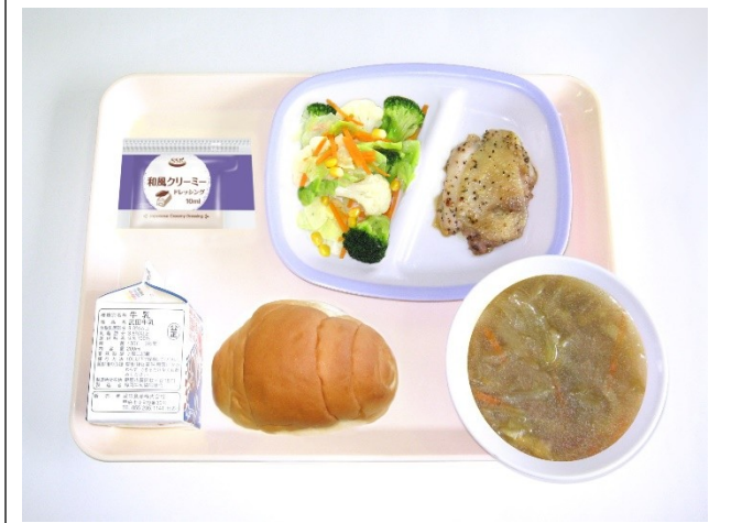
9月21日(木) バターロールパン・オニオンスープ チキンのレモンペッパー焼き・花野菜サラダ