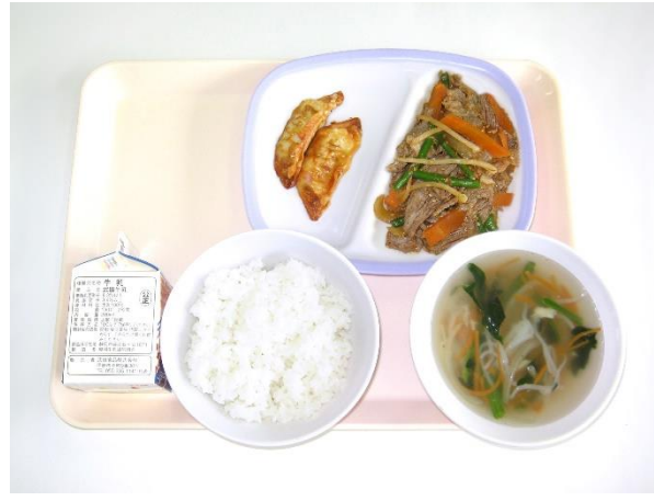
12月5日(火) ご飯・春雨スープ・プルコギ・揚げぎょうざ