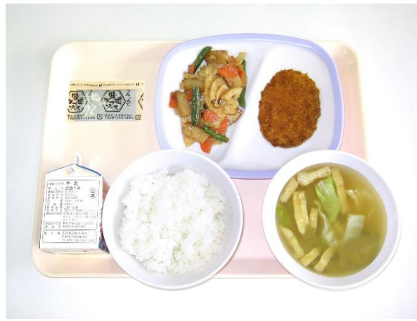
12月12日(火) ご飯・キャベツの味噌汁・みそチキンカツ さつま揚げとれんこんの炒め煮