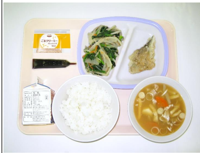
12月15日(金) ご飯・ミルク・豚汁 白身魚の玉ねぎソースかけ・ごま和え