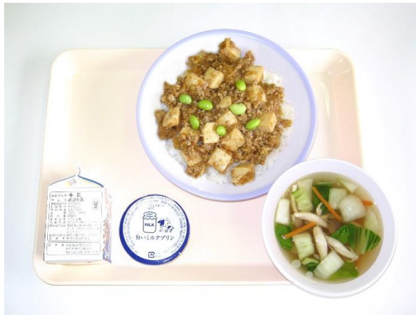
12月11日(月) マーボー豆腐丼・チンゲンサイのスープ ミルクプリン