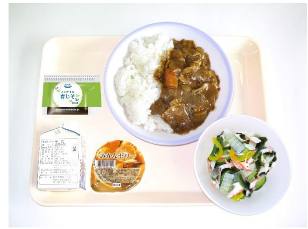
12月13日(水) ポークカレー・大根サラダ・みかんゼリー