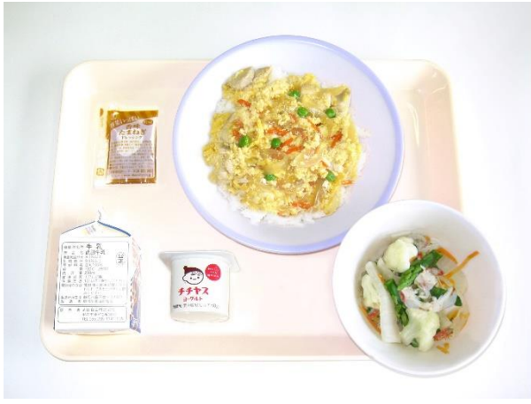
12月4日(月) 親子丼・かにかまサラダ・ヨーグルト