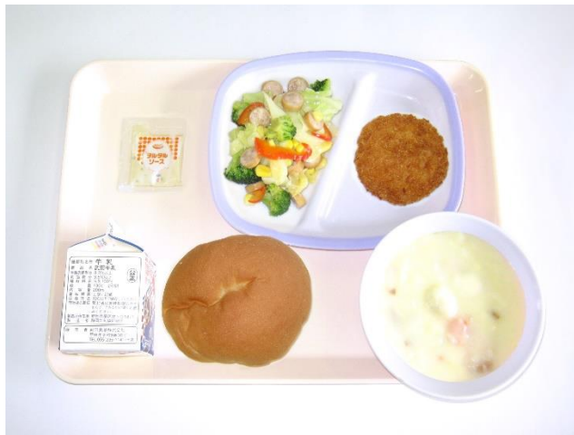
12月21日(木) えびカツバーガー・ホワイトシチュー カラフルソテー