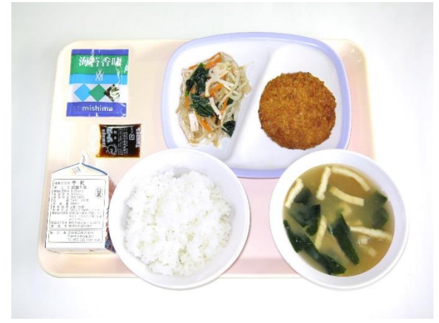
12月6日(水) ご飯・ふりかけ・わかめの味噌汁・メンチカツ 切り干し大根のサラダ