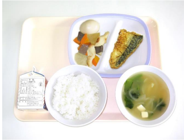
12月8日(金) ご飯・小松菜の味噌汁・さばの竜田揚げ おでん風煮・煮卵