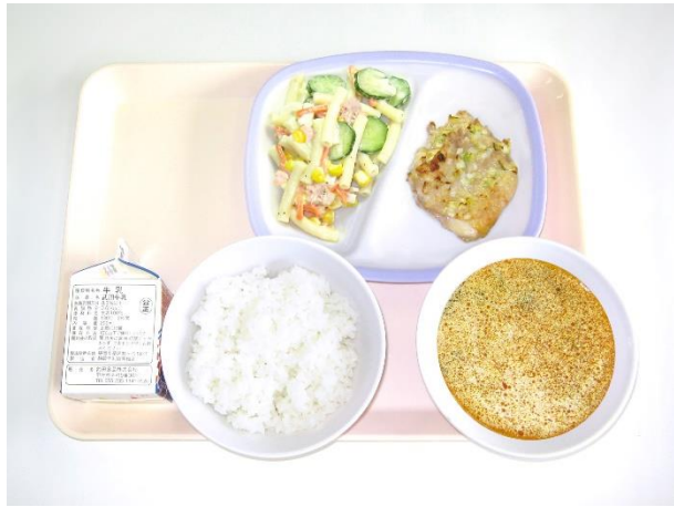
12月18日(月) ご飯・坦々スープ・鶏肉のねぎ塩焼き マカロニサラダ