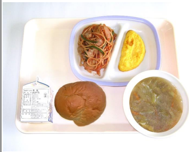
12月14日(木) 黒糖パン・オニオンスープ・オムレツ ナポリタン