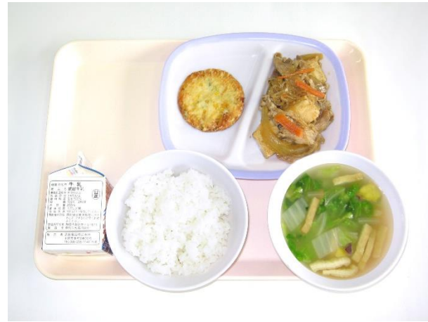
12月19日(火) ご飯・さつまいもの味噌汁・肉豆腐 コーンのキャベツ揚げ