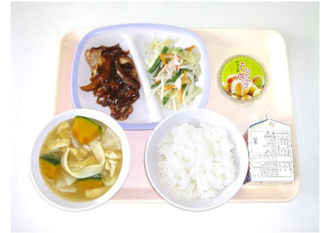
12月20日(水) ～「こうふ開府の日」お楽しみ給食～ ご飯・ほうとう・県産豚のソテー赤ワインデミソース・和風サラダ・うめジャムゼリー