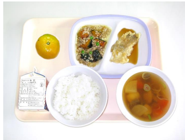
12月22日(金)～冬至給食～ ご飯・のっぺい汁・たらゆずレモンソースかけ かぼちゃのそぼろ煮・みかん