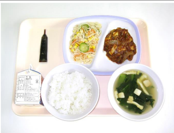
2月6日（火） ご飯・ミルクコーヒー・小松菜の味噌汁 ハンバーグのデミソース、春雨サラダ