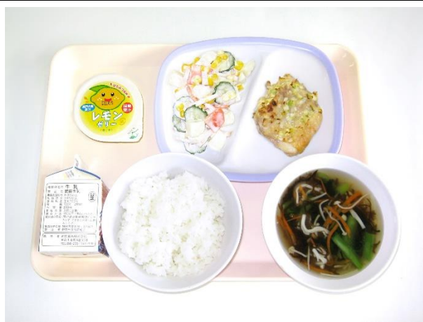
2月5日（月） ご飯・もずくスープ・鶏肉のねぎ塩焼き ポテトサラダ・レモンゼリー