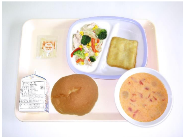
2月22日(木) フィッシュバーガー・トマトクリームスープ カラフルソテー