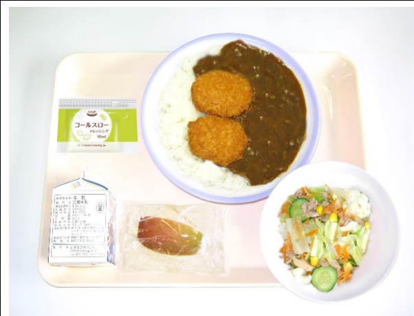
2月7日（水） かつカレー・コースローサラダ・りんご