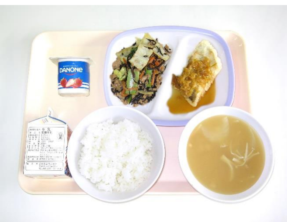
2月9日（金） ご飯・豆腐の味噌汁・白身魚の香味ソース ひじきのそぼろ煮・ヨーグルト