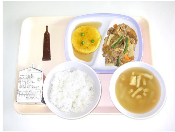
2月27日(火) ご飯・ミルクココア・大根の味噌汁 豚肉の生姜炒め・かに玉風