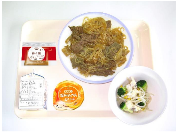
2月26日(月) 牛丼・棒々鶏風サラダ・みかんゼリー