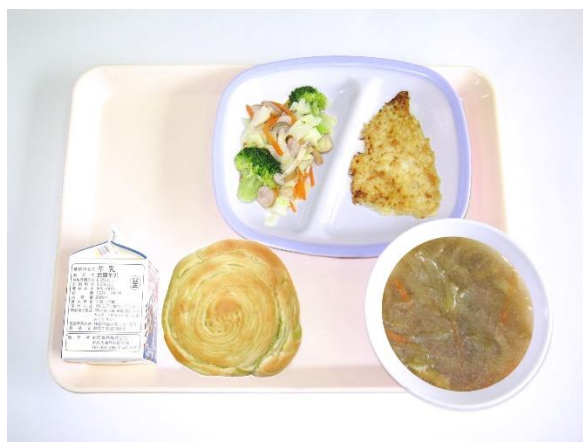
2月8日（木） シャインマスカットクルクルパン オニオンスープ・鶏肉のパン粉焼き・野菜ソテー