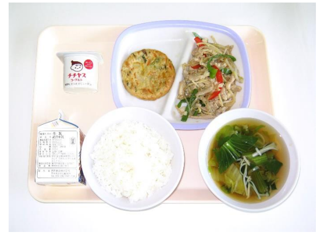
2月21日(水) ご飯・白菜のスープ・青椒肉絲・チヂミ ヨーグルト