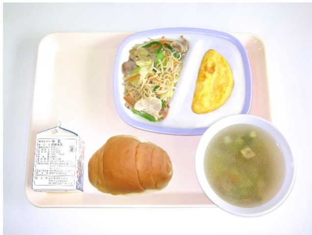
2月29日(木) バターロールパン・パイザンヌスープ オムレツ・塩焼きそば