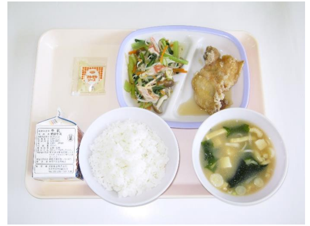
2月28日(水) ご飯・わかめの味噌汁・チキン南蛮 和風サラダ