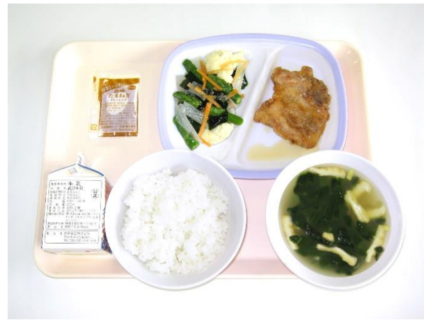
2月20日(火) ご飯・ほうれん草の味噌汁 鶏肉のゆずレモンソースかけ・わかめサラダ