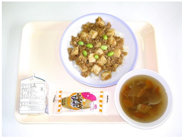
2月19日(月) マーボー豆腐丼・根菜スープ・スイートポテト