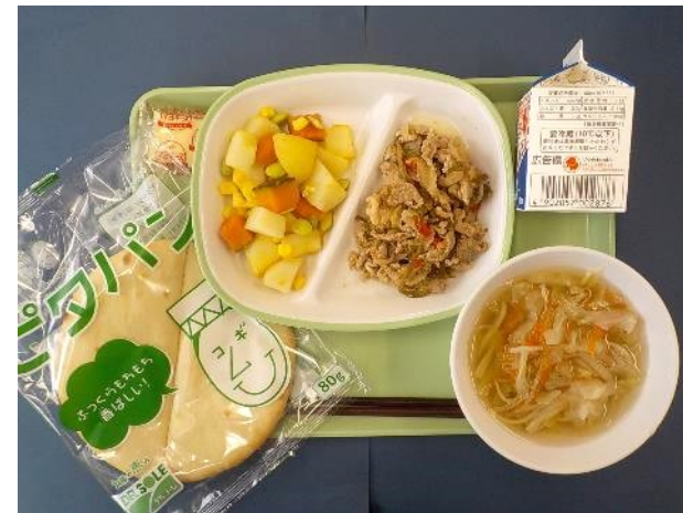
2月28日（水） ピタパン・ぎゅうにゅう・ やきにく・パンポテサラダ・ジュリアンヌスープ