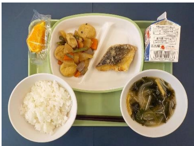
2月29日（木） ごはん・ぎゅうにゅう・ ほっけのからあげ・がんもどきとだいこんのもの・ わかめのみそしる・デコポン