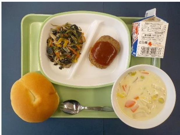
2月26日（月） リングパン・ぎゅうにゅう・ ハンバーグデミグラスソースかけ・カラフルソテー・ はくさいのクリームスープ