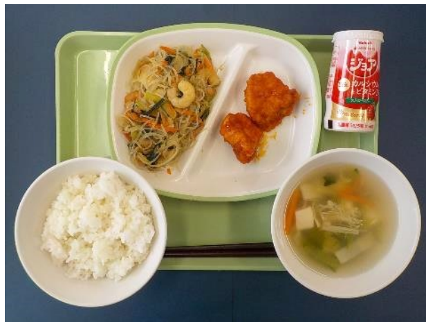
2月27日（火） ごはん・にゅういんりょう・ ヤンニョムチキン・やさいのチャプチェ・ ごもくスープ