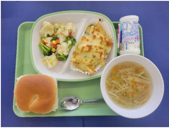
3月18日(月) こどもパン・にゅういんりょう・マカロニグラタン・ はなやさいサラダ・ジュリアンヌスープ