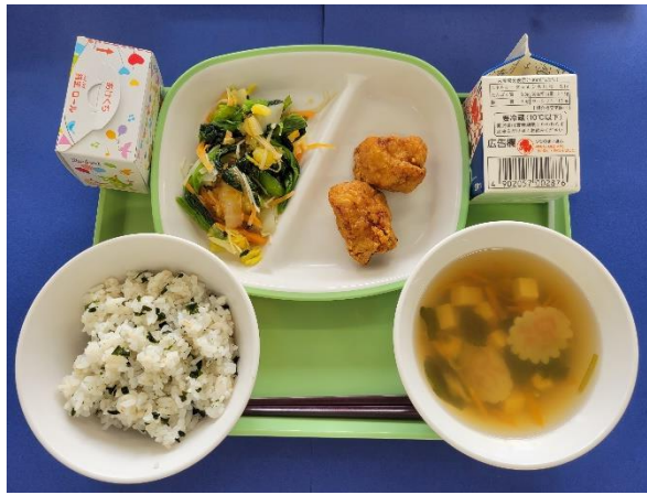
3月19日(火) <卒業お祝い給食> わかめごはん・ぎゅうにゅう・とりにくのからあげ・ わふうサラダ・すましじる・おいわいデザート