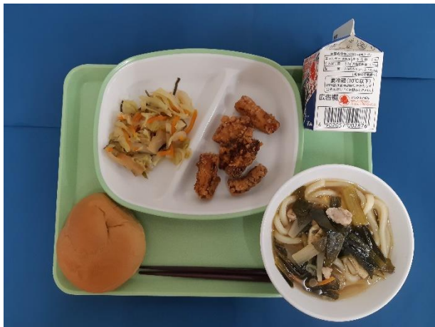
10月19日(木) こくとうパン・にこみうどん・ぎゅうにゅう いかのかりんとあげ・キャベツのしおこんぶいため