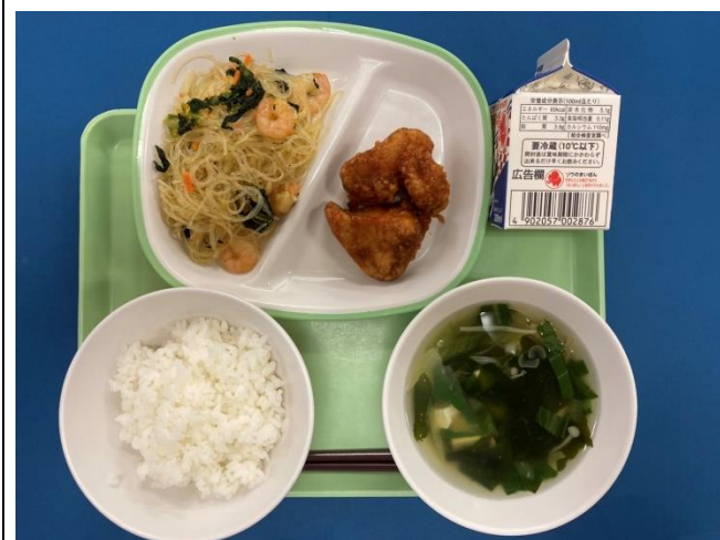
10月26日(木) ごはん・ぎゅうにゅう・ユーリンチー やさいのチャプチェ・わかめスープ