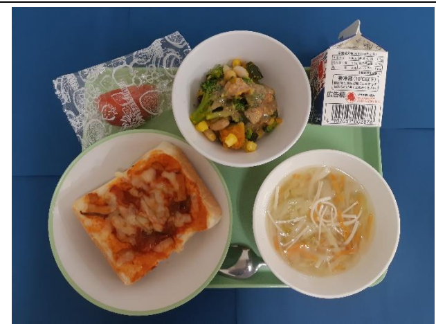
10月25日(水) ピザトースト・ぎゅうにゅう かぼちゃとまめのサラダ・ジュリアンヌスープ りんご