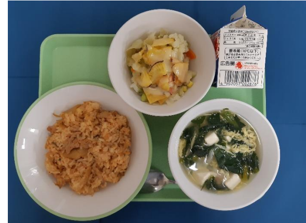
10月18日(水) キムチチャーハン・ぎゅうにゅう・チップスサラダ たまごスープ