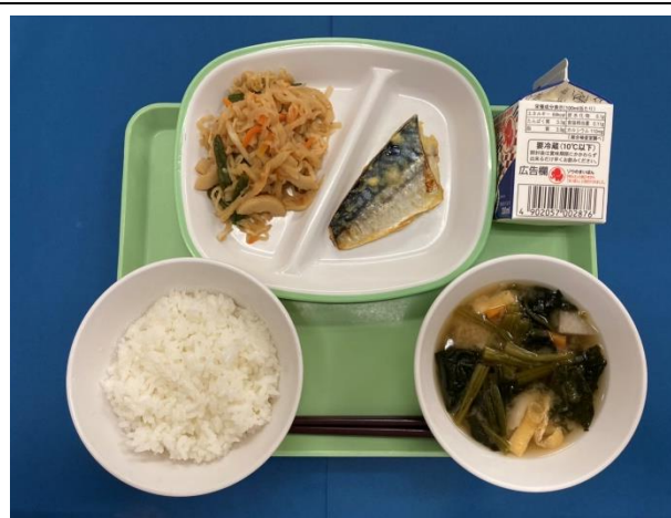
10月24日(火) ごはん・ぎゅうにゅう さばのしおこうじカレーやき きりぼしだいこんのもの・さといものみそしる