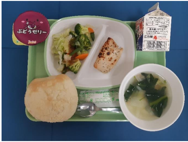
10月16日(月) そぼろパン・ぎゅうにゅう とりにくのレモンふうみやき・グリーンサラダ ラビオリスープ