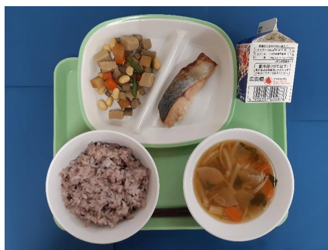
10月27日(金) ～じゅうさんやきゅうしょく～ しこくまいごはん・ぎゅうにゅう さけのさいきょうやき・ごもくまめ・おつきみじる