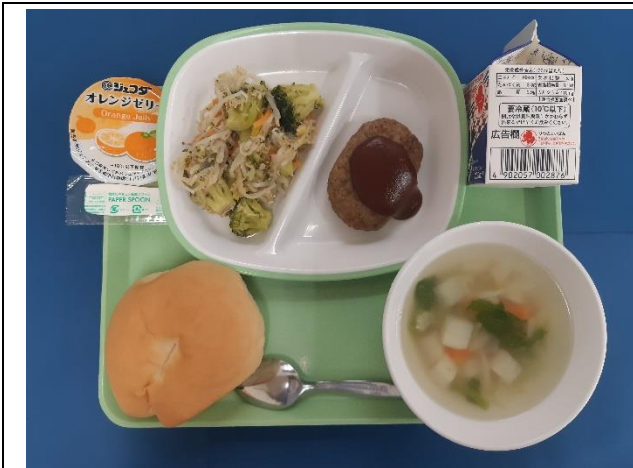
10月23日(月) アーチパン・ハンバーグデミグラスソースかけ ツナとやさいのソテー・マセドアンスープ・ オレンジゼリー