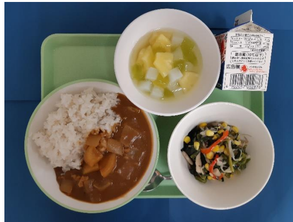
10月20日(金) カレーライス・ぎゅうにゅう・カラフルソテー シャインマスカットジュレ