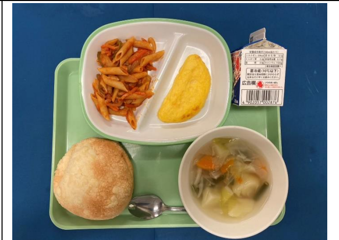
9月18日（水） そばろパン・ぎゅうにゅう・オムレツ トマトソースペンネ・ポトフ