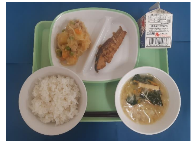
9月4日（水） ごはん・ぎゅうにゅう・さけのさっぱりやき にくじゃが・キャベツのみそしる