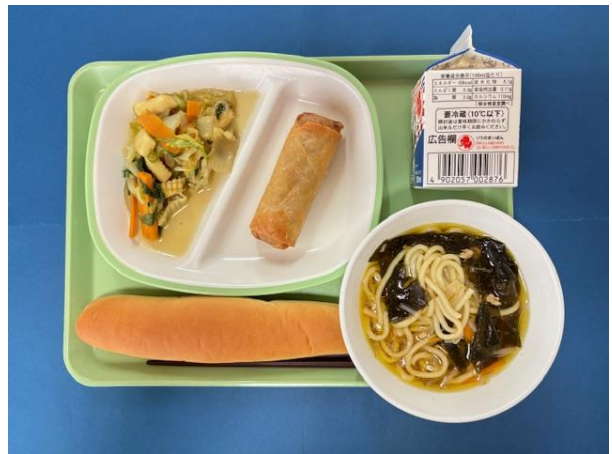
9月5日（木） ステッキパン・しょうゆラーメン・ぎゅうにゅう はるまき・ちゅうかいため