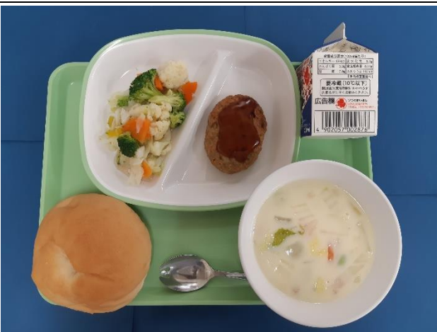
9月20日（金） リングパン・ぎゅうにゅう ハンバーグてりやきソースかけ・カラフルサラダ はくさいのクリームスープ