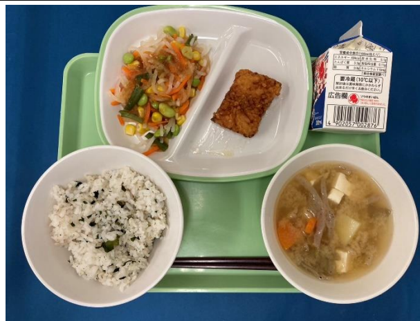
9月10日（火） わかめごはん・ぎゅうにゅう いかのたつたあげ・だいこんサラダ みそけんちんじる