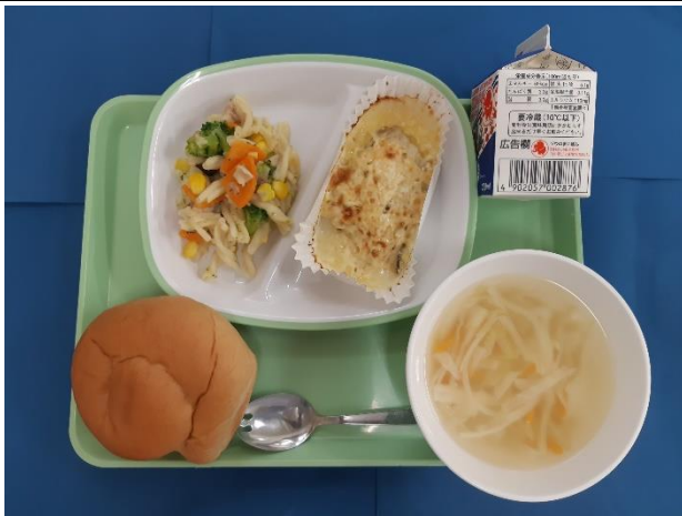
9月9日（月） こくとうパン・ぎゅうにゅう しろみざかなのタルタルソースやき マカロニのソテー・ジュリアンヌスープ