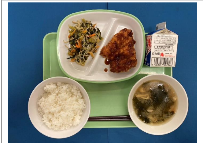
9月19日（木） ごはん・ぎゅうにゅう・チキンカツ のざわないため・だいこんのみそしる