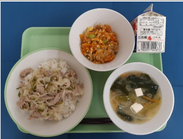
9月2日（月） ねぎしおぶたどん・ぎゅうにゅう にんじんしりしり・あおなのみそしる