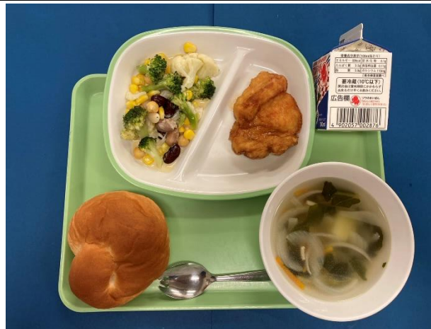
9月3日（火） ミルクパン・ぎゅうにゅう・とりにくのレモンに ビーンズサラダ・コンソメスープ