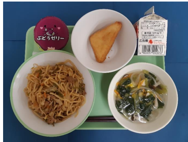
9月13日（金） やきそば・ぎゅうにゅう・チーズはんぺんフライ やさいスープ・ぶどうゼリー