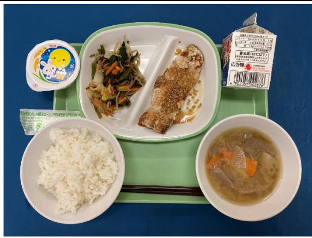
9月17日（火） ～十五夜給食～ ごはん・ぎゅうにゅう・さんまのかばやき はくさいのおかか・いものこじる・おつきみデザート