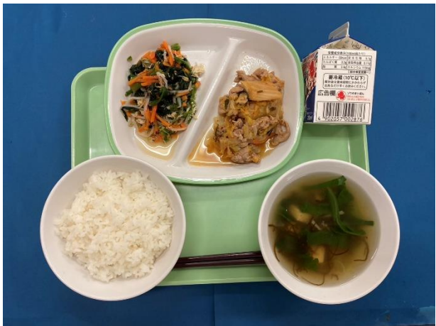
9月12日（木） ごはん・ぎゅうにゅう・ぶたキムチいため ナムル・もずくスープ