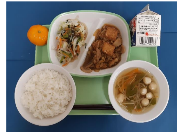
9月6日（金） ごはん・ぎゅうにゅう・あつあげとぶたにくのみそに やさいのドレッシングかけ・すましじる れいとうみかん