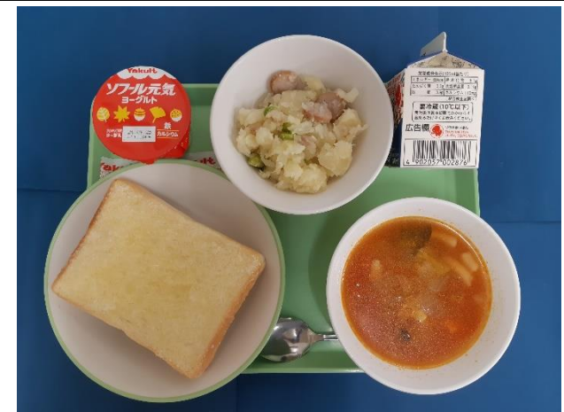
9月11日（水） シュガートースト・ぎゅうにゅう ジャーマンポテト・トマトスープ・ヨーグルト