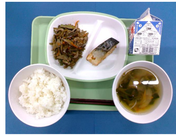
5月13日(水) ごはん・牛乳・さばのピリ辛焼き 茎わかめのきんぴら・肉団子スープ・ ヨーグルト