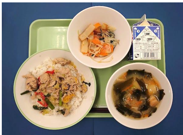
5月21日(木) 元気もりもり丼・牛乳・ 青菜の炒め物・麩のみそ汁