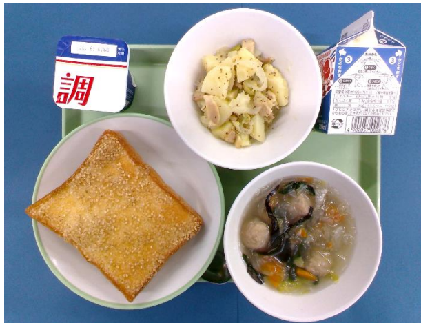
5月14日(木) セサミトースト・牛乳・ じゃがいもの粒マスタード炒め・ 肉団子スープ・ヨーグルト