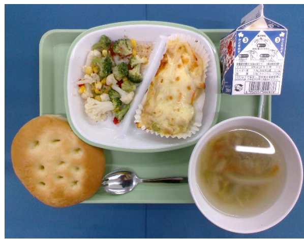
5月29日（金） フォカッチャ・牛乳・ ひよこ豆のグラタン・花野菜サラダ・ 糸かまスープ