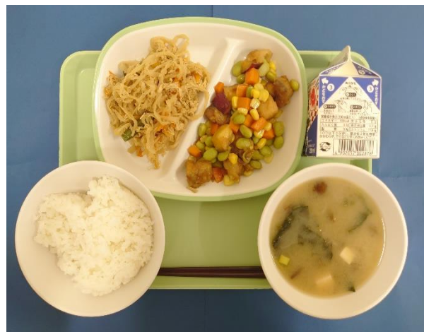
5月19日(火) ごはん・牛乳・あじの五色揚げ・ 切干しだいこんの煮物・なめこ汁