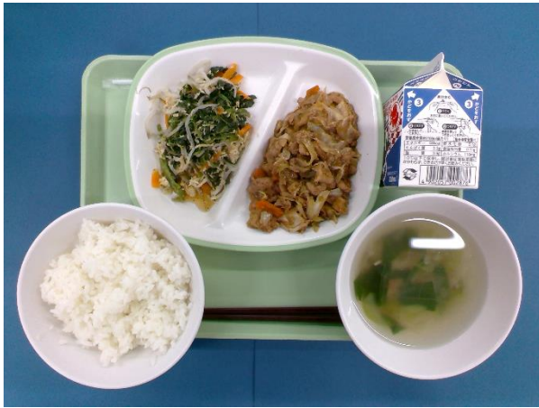
5月11日(月) ごはん・牛乳・ホイコーロー・ ナムル・チンゲンサイのスープ