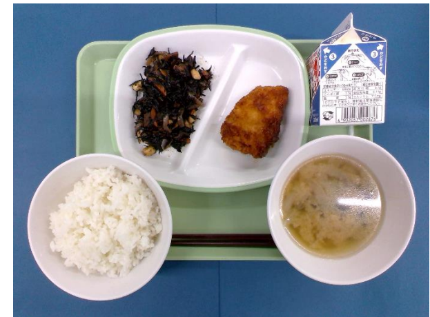
5月27日（水） ごはん・牛乳・ チキンカツ・ひじきの煮物・ たまねぎのみそ汁