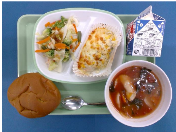
5月26日（火） 黒糖パン・牛乳・ 白身魚のコーンマヨネーズ焼き・ グリーンサラダ・ラビオリスープ