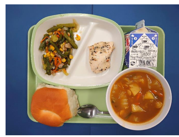
5月20日(水) こどもパン・牛乳・ チキンのバジル焼き・アスパラガスのソテー・ カレーポトフ