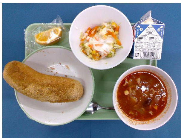
5月22日(金) きな粉揚げパン・牛乳・ コールスローサラダ・ポークビーンズ・ オレンジ