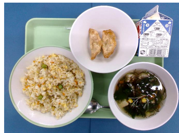
5月15日(金) たまご入りチャーハン・牛乳・ 揚げぎょうざ・もずくスープ