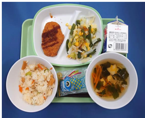
5月1日（金） たけのごはん・牛乳・かつおフライ 野菜のおろしドレッシングかけ・すまし汁・柏餅