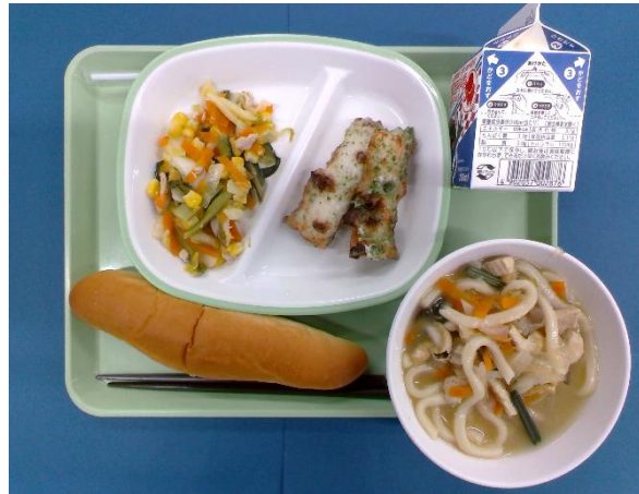
5月12日(火) ステッキパン・山菜うどん・牛乳・ ちくわの磯辺揚げ・いろいろ炒め