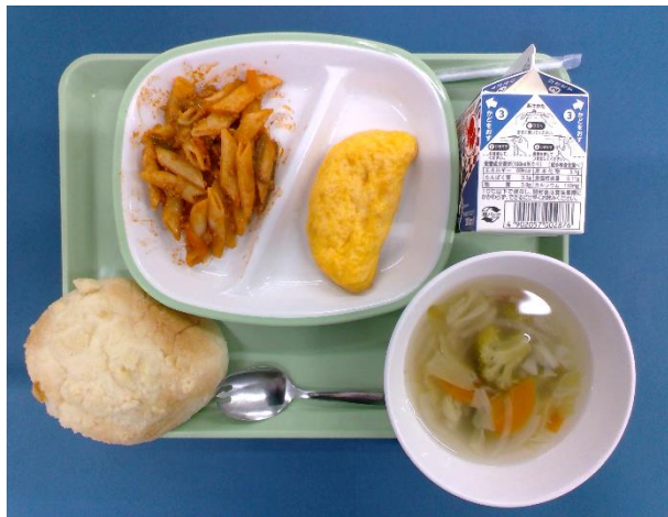
5月18日(月) そばろパン・牛乳・オムレツ・ トマトソースペンネ・野菜スープ