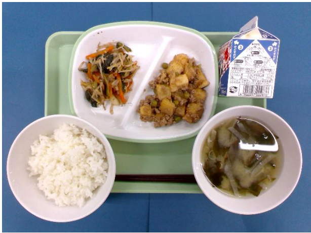
5月25日（月） ごはん・牛乳・揚げじゃがいものそぼろ和え・ 小松菜のおかか煮・だいこんのみそ汁