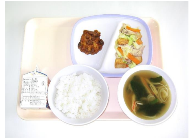
6月24日(水) ご飯・すまし汁・厚揚げの炒め物・たこ焼き