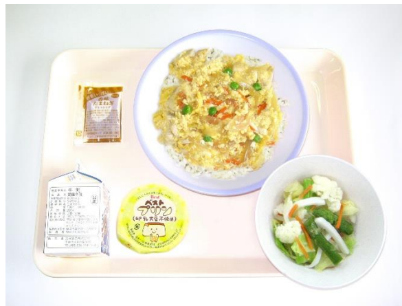
6月12日(金) 親子丼・キャベツのサラダ 卵・乳・大豆不使用プリン