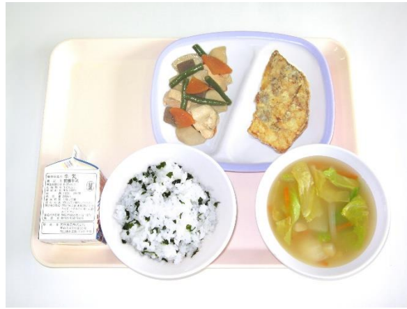
6月23日(火) わかめご飯・白菜の味噌汁・白身魚の竜田揚げ 筑前煮