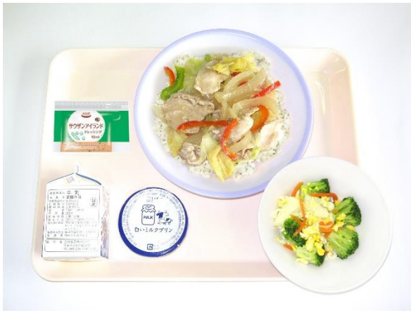
6月22日(月) ねぎ塩豚丼・ミモザサラダ・ミルクプリン