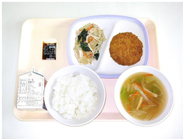
6月26日(金) ご飯・春雨スープ・メンチカツ・大根のナムル