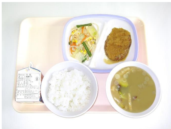
6月8日(月) ご飯・さつまいもの味噌汁 ハンバーグおろしソース・春雨炒め