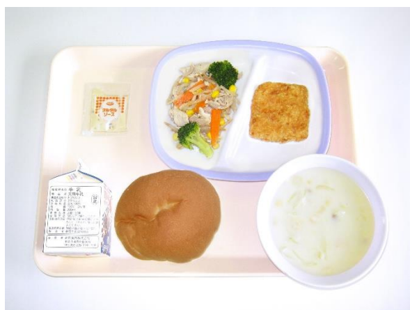
6月11日(木) フィッシュバーガー・コーンスープ カラフルソテー