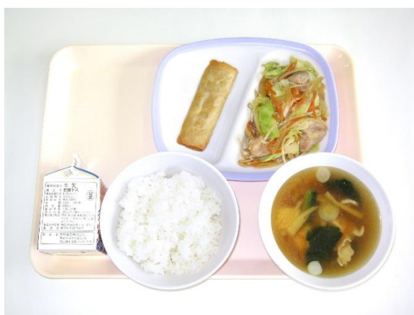
6月9日(火) ご飯・スーラータン キャベツと鶏肉のオイスター炒め・春巻