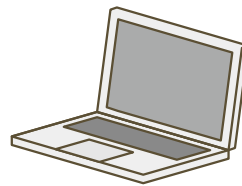
โน้ตบุ๊ก