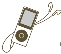
เครื่องเล่นเพลง