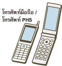
โทรศัพท์มือถือ / โทรศัพท์ PHS