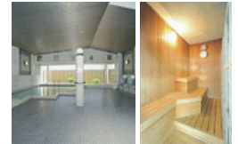
ห้องอาบน้ำ