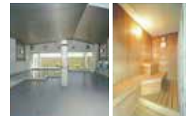
Phòng tắm Xông hơi