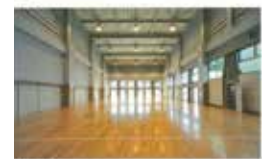
Phòng thể dục