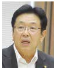
政友クラブ 一般質問(分割)