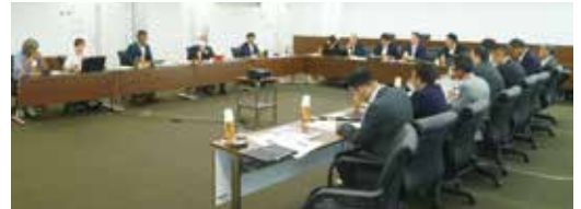
犬山市での視察の様子

※議会政策サイクルとは、各政策について、目標に照らし合わせて効果を検証し、提言を行い、これらを循環して実施する取組です。