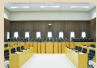
議場から見た傍聴席