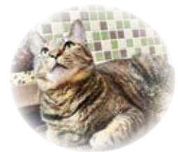
引き取られた犬、猫たち