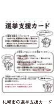
札幌市の選挙支援カード

選挙支援カードの導入については、実施している他都市の状況等について調査・研究を行ってまいります。