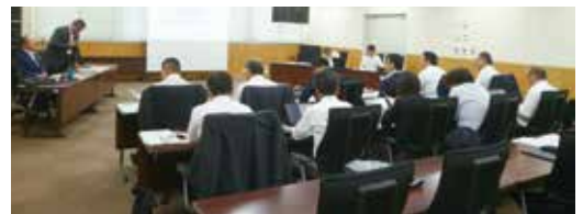
飯田市での視察の様子