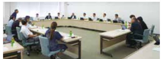
岩倉市での視察の様子