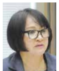
政和こうふ 一般質問(分割)

A 本市職員が「山梨県保育等人材確保・定着等協議会」の委員となり、保育や幼児教育に携わる人材確保等の情報収集に努め、また、障がい児保育に係る補助制度の拡充とともに、子どもがいる保育士へは、市内の保育所等の入所選考で加点をする優遇策も設けています。更に、保育記録の作成等を効率的に処理できるICT業務支援ツールを活用し、事務的業務負担軽減の効果検証を進めております。