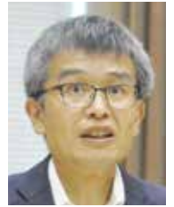
日本共産党 一般質問(分割)