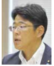
政和こうふ 代表質問(分割)