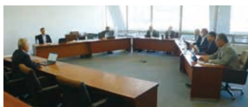
福島市における視察の様子