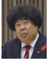
政和こうふ 一般質問(分割)