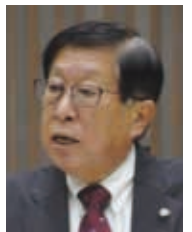
政和こうふ 代表質問(分割)