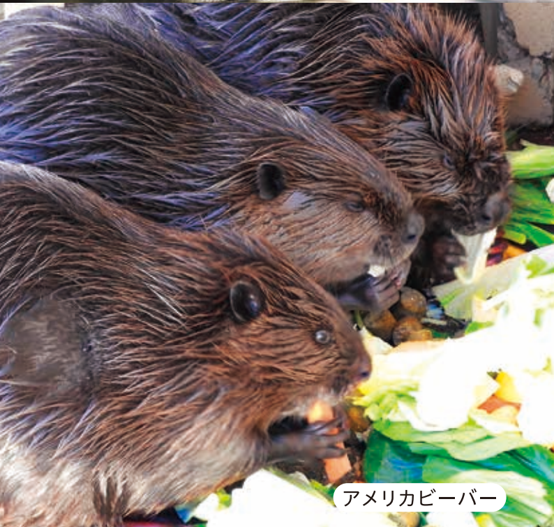
アメリカビーバー