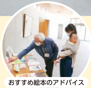
おすすめ絵本のアドバイス

終了後は反省会を行い、年間計画をもとに読 み聞かせ担当者による練習や、おすすめの絵本 も入念に確認して次の開催に備えます。