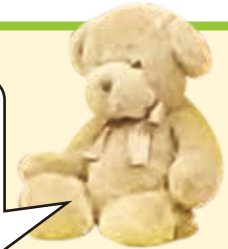
マスコットのくまさん

ちびちびひろば は、毎月第2水曜日午前11時から 甲府市立図書館第1会議室で絵本の読み聞かせ、 わらべうた、おすすめ絵本の紹介もしています!!