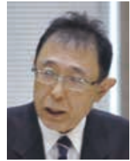
政友クラブ 代表質問(分割)