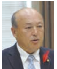
政和こうふ 一般質問(分割)

A 今年度は、森林整備の一層の効率化を図るため、航空写真を活用した森林状況や地形情報のデジタル化を開始するとともに、木材の新たな利用を促進し価値の向上を目指すため、全国初となる市有林のカラマツの間伐材を活用した「木糸」から布製品の作成に取り組んでおり、本市の子どもたちにも天然素材ならではの、木のぬくもりや安全性に触れてほしいとの思いから、令和6年度より新生児に配布できるよう準備を進めているところであります。