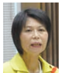
公明党 一般質問(分割)