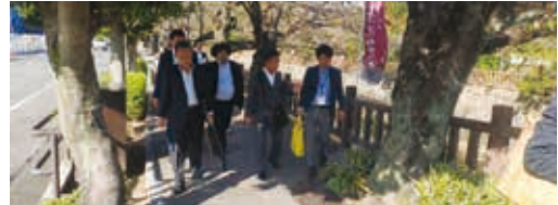
大垣市における視察の様子