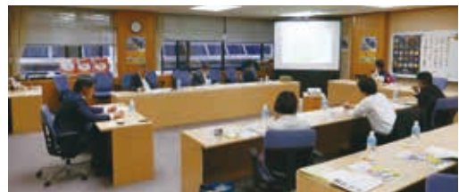
宇都宮市における視察の様子