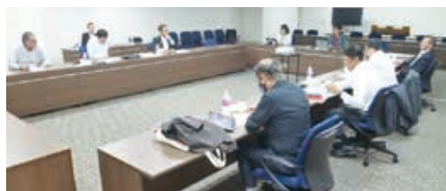
真岡市における視察の様子