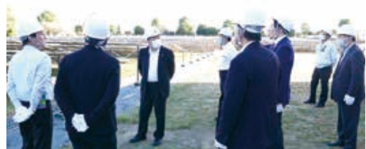
佐野市における視察の様子