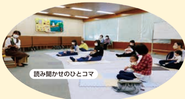
読み聞かせのひとコマ