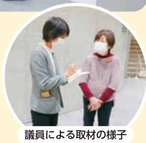
議員による取材の様子