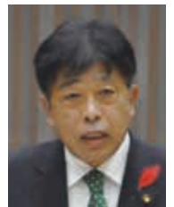
公明党 代表質問(分割)