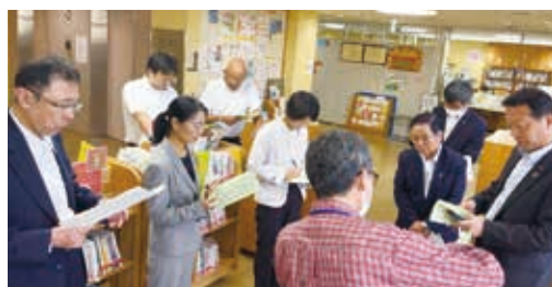
京都市における視察の様子