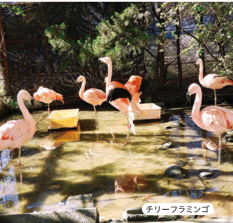
チリーフラミンゴ