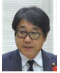
市民クラブ 代表質問(分割)