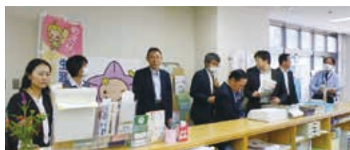
掛川市における視察の様子