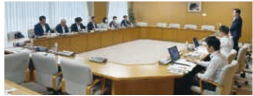
豊田市における視察の様子