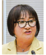
政和こうふ 代表質問(分割)