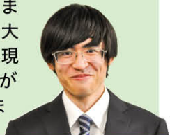
一兜さん：片田ゼミ

実際の困りごとを政策に結びつけるため、生の声をデータ以上に大切にしました。調査は大変でしたが、現場にこそ答えがあると感じました。