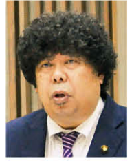
政和こうふ 一般質問(分割)