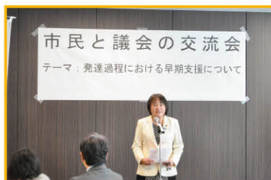
民生文教委員会の交流会の様子