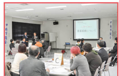
経済建設委員会の交流会の様子