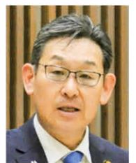
こうふ明水会 一般質問(分割)

A 情報を収集し共有するとともに積極的な情報発信にも努め、インドカレーのみならず、様々なイベントを通じて、中心市街地の賑わいにつなげてまいります。交流については、人材・産業・観光などの分野での連携・協力に向けて新たな関係構築に取り組んでまいります。 ■その他の質問事項 ・ごみの減量化について 他