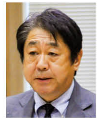
市民クラブ 代表質問(分割)