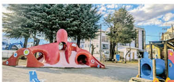
たちばな児童公園

A 本市都市公園のトイレの洋式化については、利用者が多く集う緑が丘スポーツ公園や遊亀公園など、大規模な公園の再整備の中で実施しております。そのほかの公園におきましては、点検、清掃及び修繕を行いつつながら、老朽化のみならず、立地特性などを考慮する中で、その必要性を見極めてまいります。