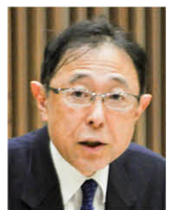
こうふ明水会 代表質問(分割)