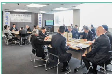
総務委員会の交流会の様子

農業に携わる皆様と農業の現状や課題、これからの農業の可能性などについて意見交換を行いました。