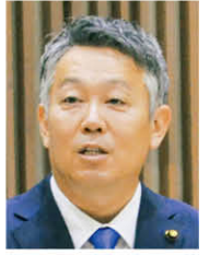
こうふ未来 代表質問(分割)