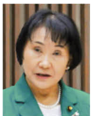
日本共産党 代表質問(分割)