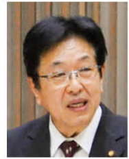
政友クラブ 代表質問(分割)