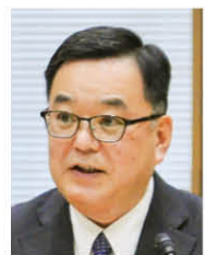
公明党 代表質問(分割)

A 市内の全ての児童生徒の保護者を公平に支援していく考えのもと、今後の学校給食費無償化と保護者への給付においては、社会経済情勢を見極めながら対応してまいります。また、市立小中学校以外の学校に在籍する児童生徒の保護者に対しては、各家庭に満遍なく周知し申請を促してまいります。申請手続は、年1回とし、添付書類の簡素化などに努めてまいります。 ■その他の質問事項 ・遊亀公園附属動物園リニューアルオープンに向けた「運営理念」と「甲府市動物園条例」の制定について 他