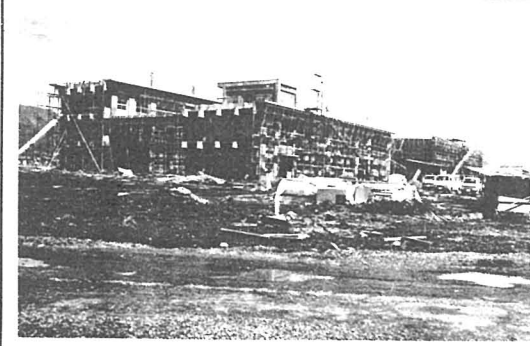
52年度開校を旨とし建設中の(仮称)南西小学校

昭和五十二年予算編成について、施策を推進してき、昭和五十年、なほ負担の減少として政の命題であり、積極的に対処に成るため、早急に見直し、我が国経済の不況により、五十年度は、戦後最大の教育費削減に五千五百円に達する。老人福祉は、生活環境整備は、甲府市が推進している。早期高齢化等について、引続き、甲府財政は、税収の伸び悩みを生じ、本市中が財政的不足が必至であり、市民の福祉を旨とする政策の推進に重大な支障をきたすので、一層の努力を要する。教育の内容の充実と併せて、良好な活動を通じ、成人教育の推進、文化、自衛、身障者支援等については、市民福祉の向上に重点的に取り組む。教育環境整備の推進、福祉サービスの充実を、市民福祉の向上に重点的に取り組む。教育環境整備の推進、福祉サービスの充実を、市民福祉の向上に重点的に取り組む。