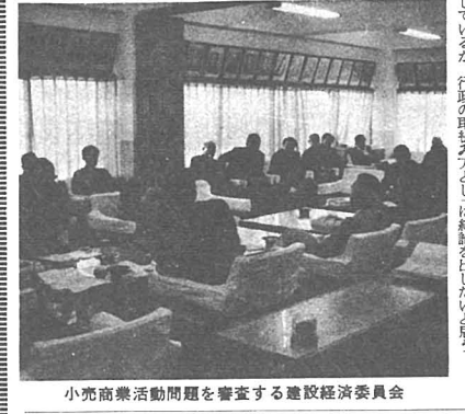
小売商業活動問題を審査する建設経済委員会