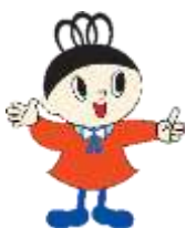
고후시 쓰레기 감량 이미지 캐릭터 리사 짱