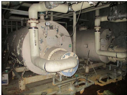
▲⑬ストレージタンク 2基