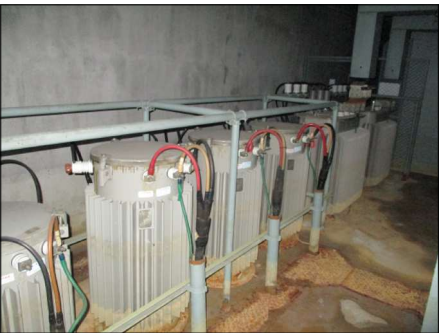
▲⑮変圧器 6基 (PCB分析済 含有無)