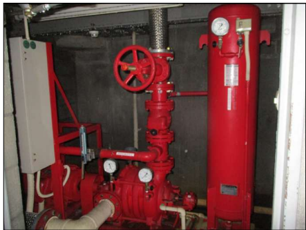
▲⑩スプリンクラーポンプ 1基