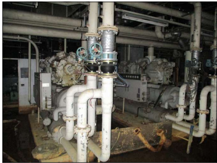
▲①チラーユニット 2基