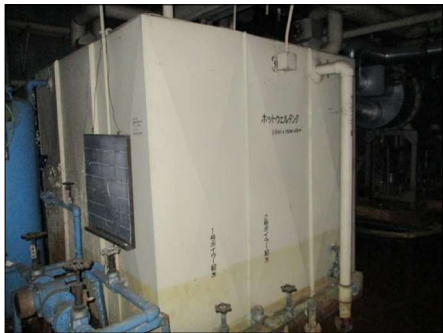
▲⑫ホットウェルタンク 1基