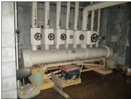
▲⑧冷却水ヘッダー 1基