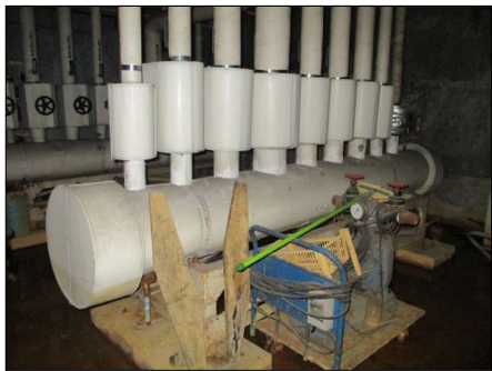
▲⑦冷温水ヘッダー 1基