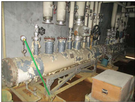
▲⑥スチームヘッダー 2基