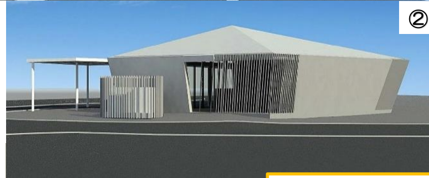
甲府市観光案内所・バスセンター