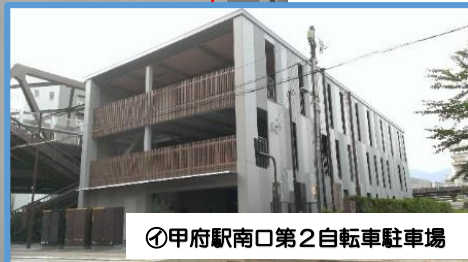
㊧甲府駅南口第2自転車駐車場