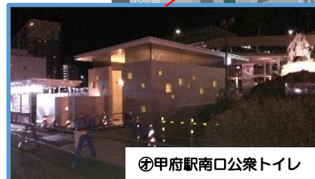
㊪甲府駅南口公衆トイレ