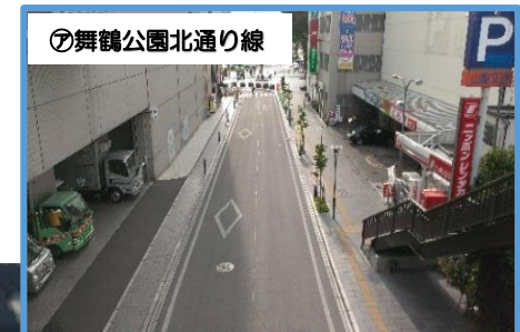
㊦舞鶴公園北通り線