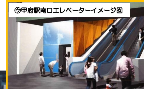
㊨甲府駅南口エレベーターイメージ図