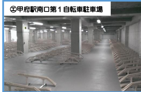
㊩甲府駅南口第1自転車駐車場