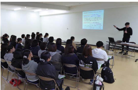
※運動遊びプレイリーダー研修会によるプレイリーダーの育成