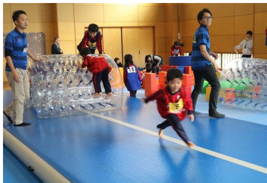
※H29年度実証事業に伴う親子イベントを開催