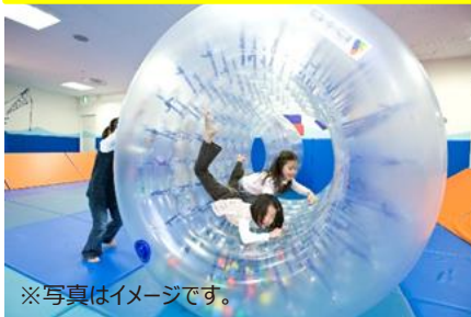
サイバーホイール (全身を360°回転させられる遊具)