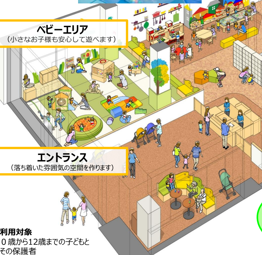
ベビーエリア (小さなお子様も安心して遊べます)