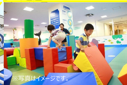
ソフトブロック (子どもの身長ほどもある大きいブロック)