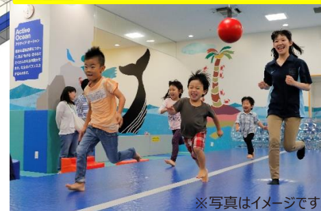
エアトラック (空気の反発力が楽しい大型トランポリン)