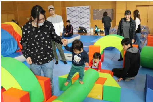
※運動遊びを通じた子どもの心身の健康づくり