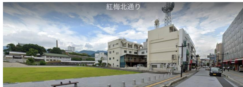
甲府城周辺地域活性化実施計画の区域

甲府城周辺地域活性化実施計画との相乗効果や甲府市中心街への波及効果を考え、設置場所を選定しました。