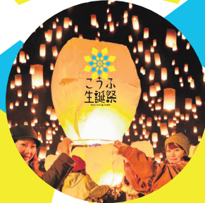
夢をせて スカイランタン

みんな大好きキャラクターショーも！ Character Show キャラクターショー