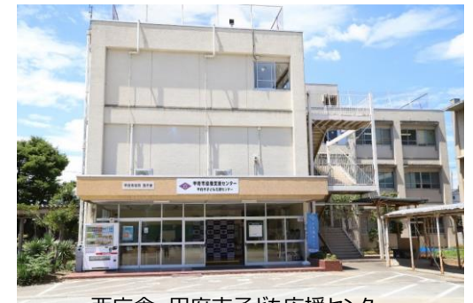
西庁舎 甲府市子ども応援センター