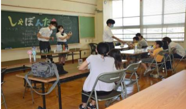
令和2年度開催 しゃぼん玉づくり体験