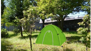
西庁舎 甲府市子ども応援センター中庭