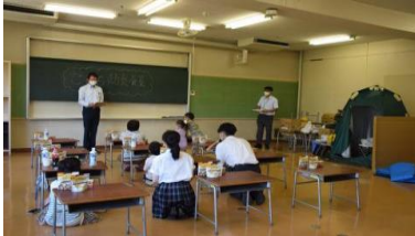
令和2年度開催 防災子ども食堂