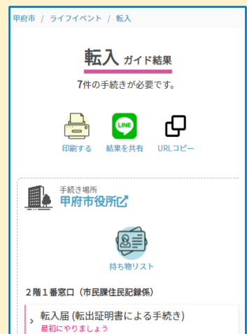
▲手続き場所や持ち物を確認