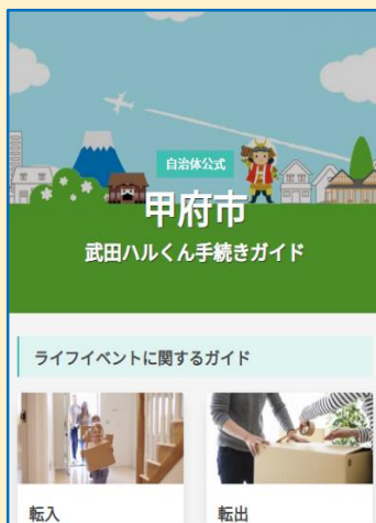
▲手続きの種類を選択