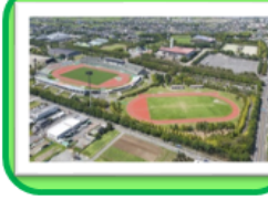
「ヴァンフォーレ甲府」の聖地「小瀬スポーツ公園」