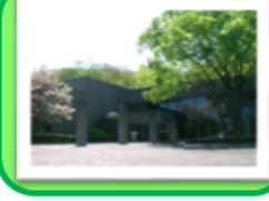
山梨の歴史を学ぶ「山梨県立考古博物館」