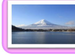
日本の象徴「富士山」