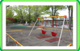
「遊亀公園」※動物園は休園中