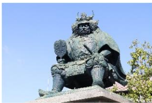
甲府駅南口 ↑武田信玄公之像が目印です。