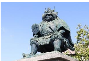
甲府駅南口 ↑武田信玄公之像が目印です。