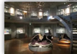
クリスタル・ミュージアム