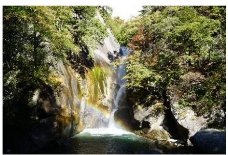
せんがたき 仙娥滝

山梨県を代表する景勝地 「昇仙峡」の最奥部に位置します。 落差30mと壮大な仙娥滝は 地殻変動によってできました。