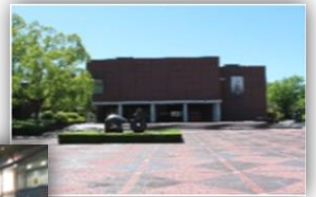
야마나시 현립 미술관