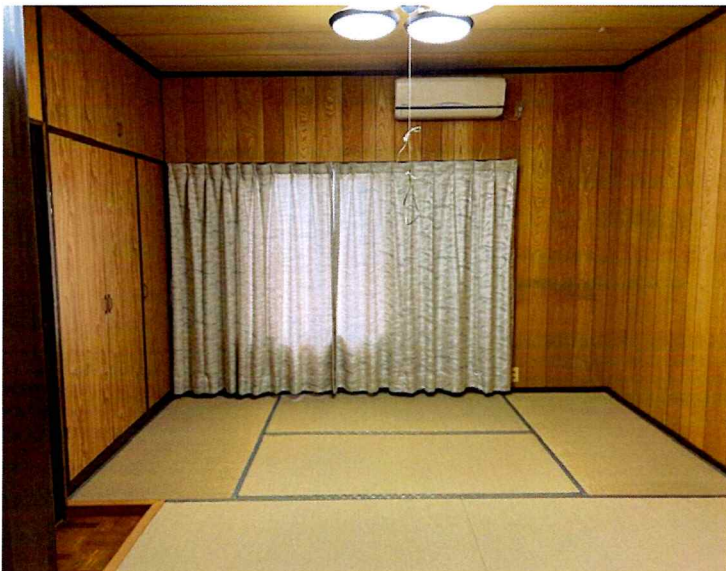
住吉2丁目2015-1 2F 南西(和室)