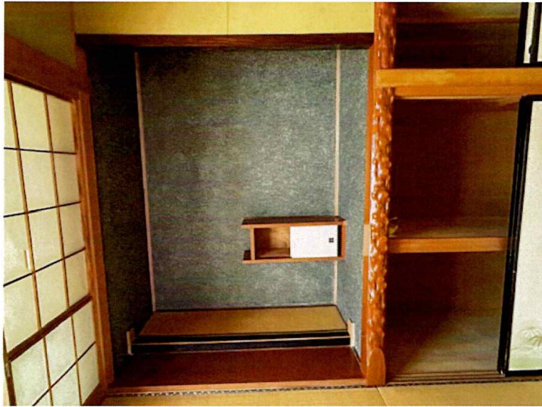
住吉2丁目2015-7 1F 南西(和室)床間