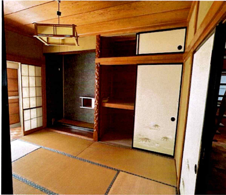
住吉2丁目2015-7 1F 南西(和室)