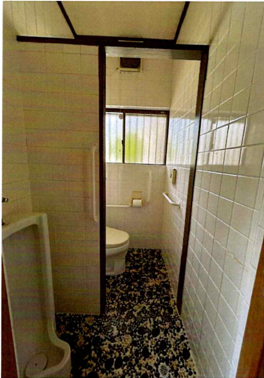
住吉2丁目2015-1 1F トイレ