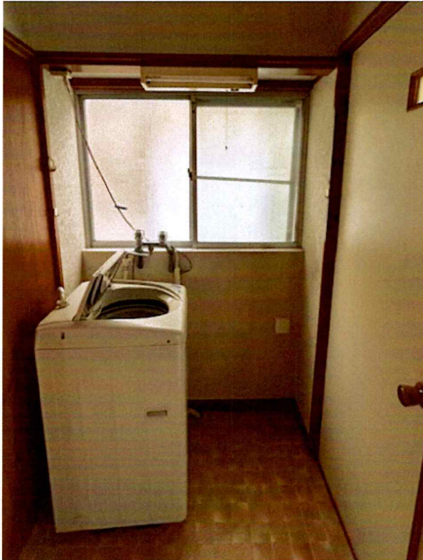
住吉2丁目2015-7 1F 洗面 所