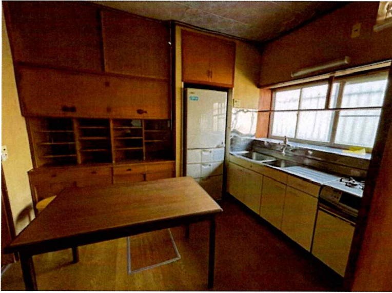
住吉2丁目2015-7 1F キッチン