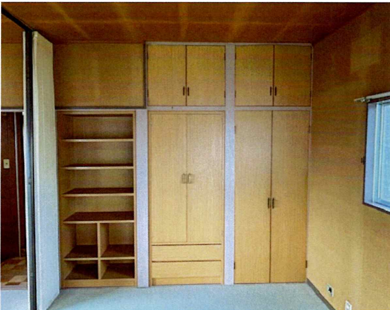
住吉2丁目2015-7 2F 南東(洋室)北側整理