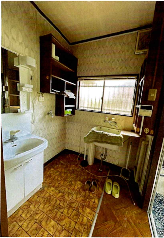
住吉2丁目2015-1 1F 洗面所