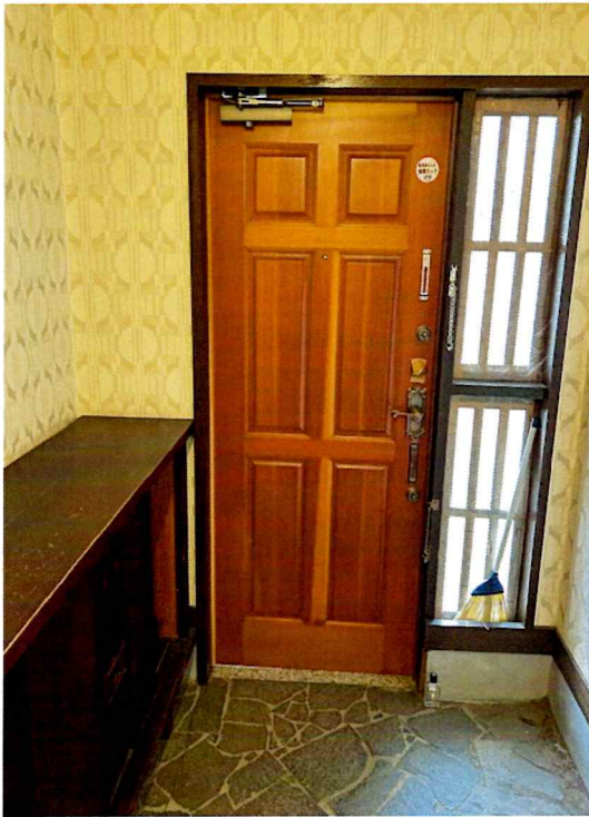
住吉2丁目2015-1 建物玄関 (内部)