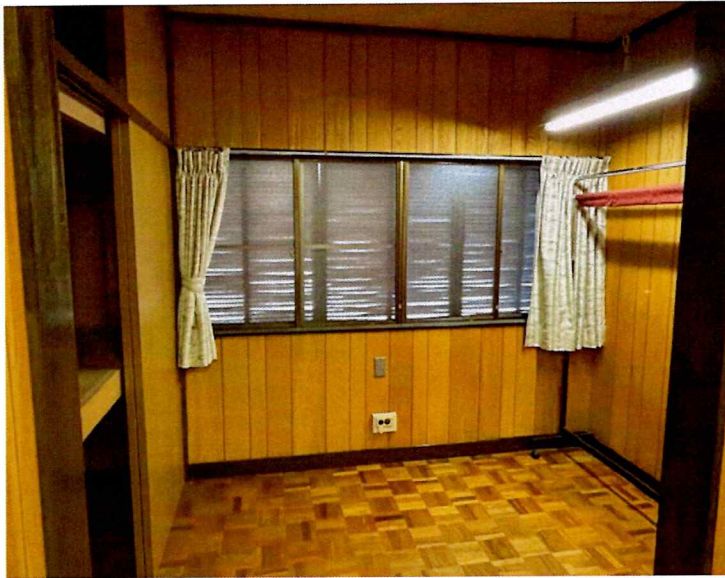
住吉2丁目2015-1 2F 北西(洋室)