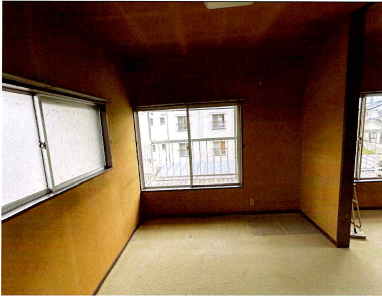
住吉2丁目2015-7 2F 南東(洋室)