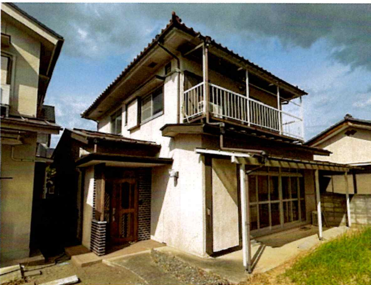
住吉2丁目2015-7 建物外観