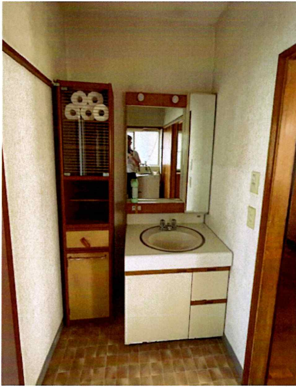
住吉2丁目2015-7 1F 洗面 所