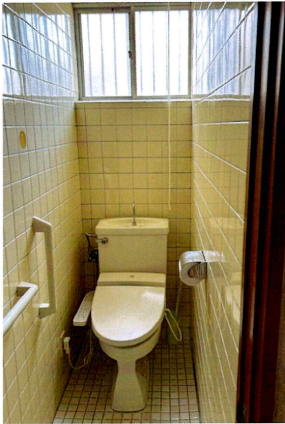
住吉2丁目2015-7 1F トイレ