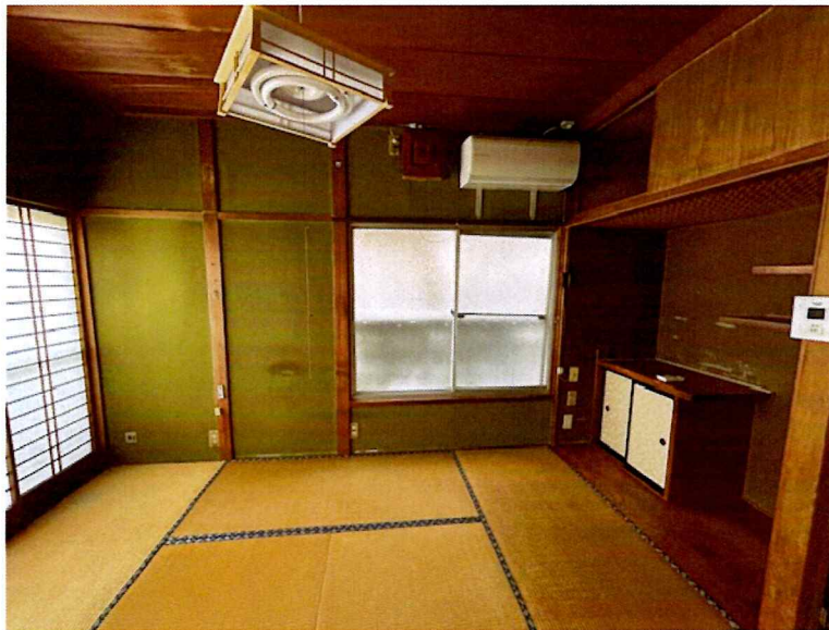
住吉2丁目2015-7 1F 北東(和室)