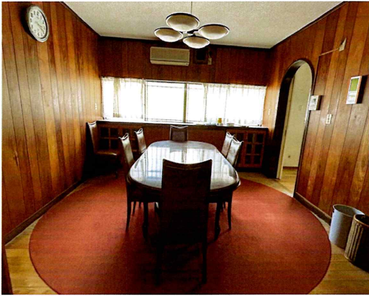
住吉2丁目2015-1 1F 居間(北側)