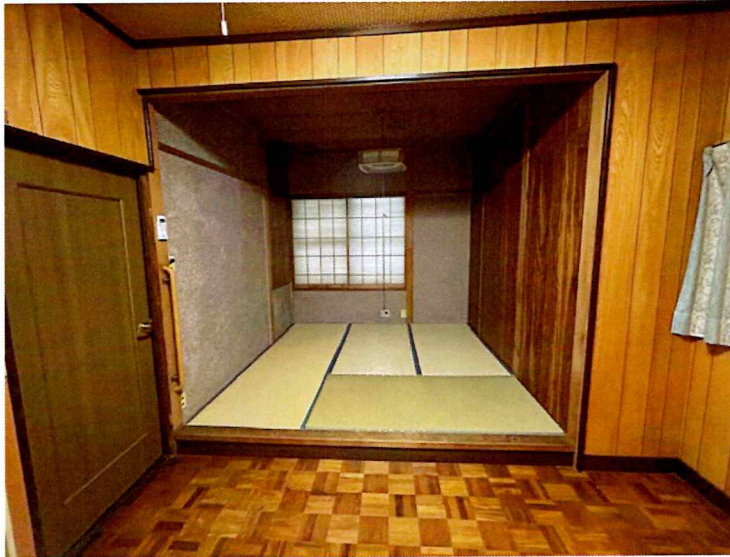
住吉2丁目2015-1 2F 北東(和室)