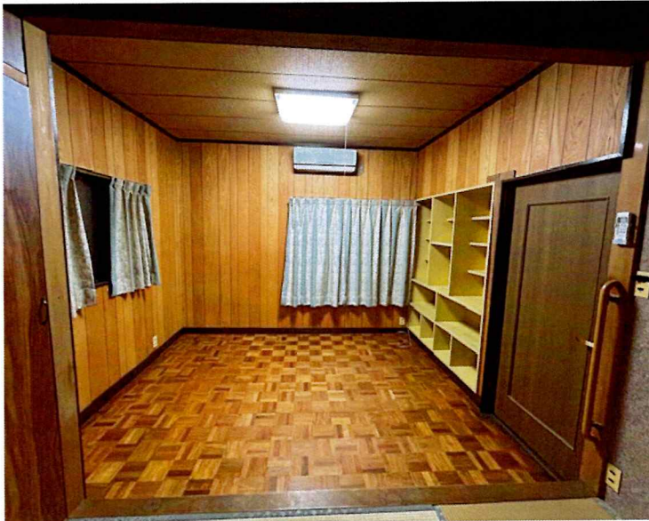
住吉2丁目2015-1 2F 南東(洋室)