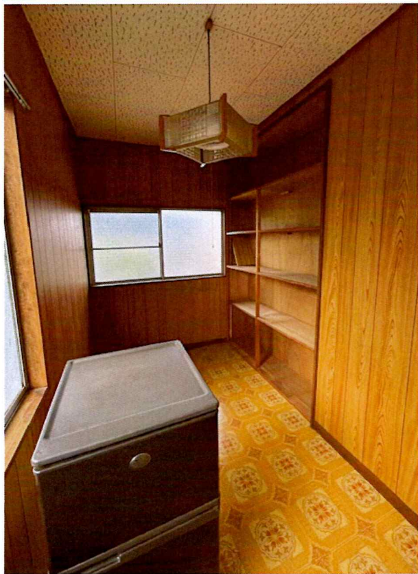
住吉2丁目2015-7 2F 北西(納戸)