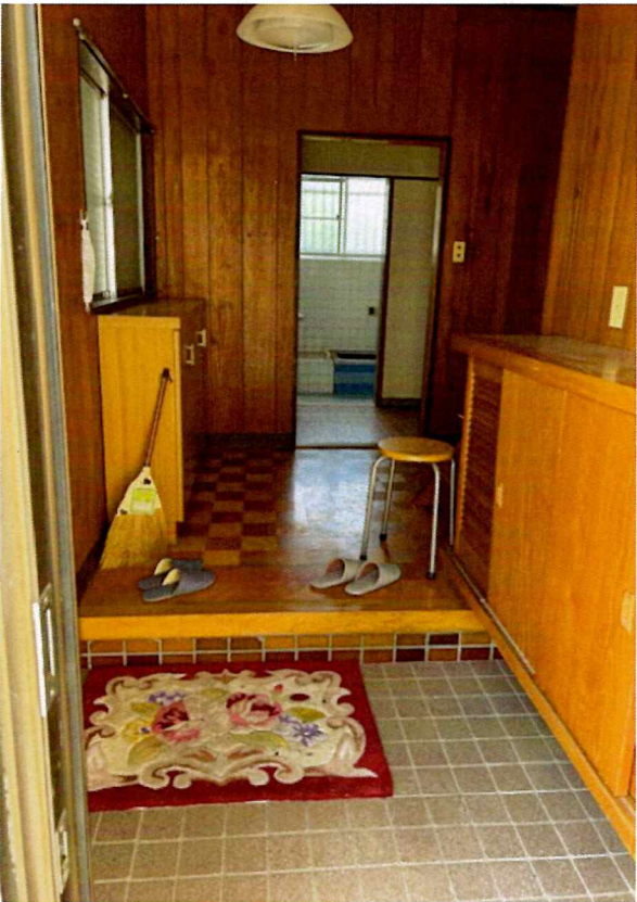
住吉2丁目2015-7 建物玄関 (内部)