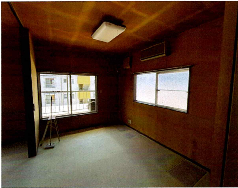
住吉2丁目2015-7 2F 南西(洋室)