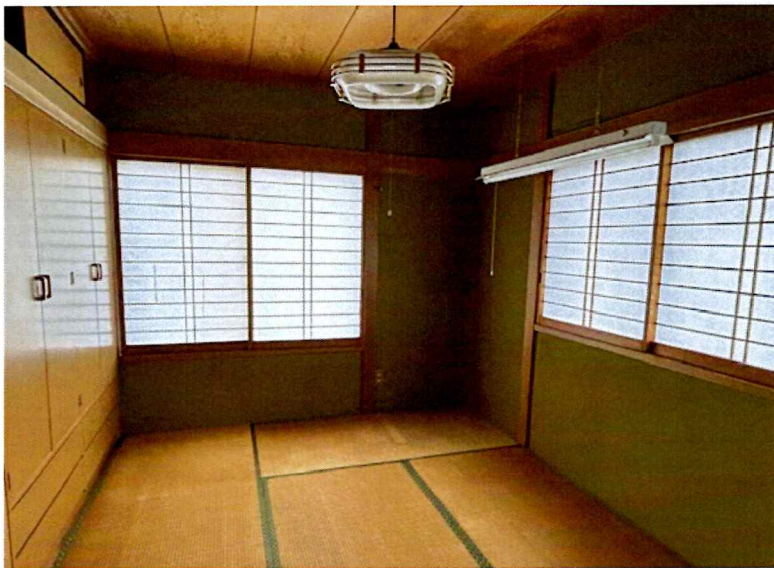
住吉2丁目2015-7 2F 北東(和室)