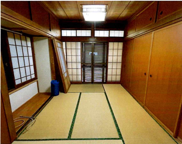
住吉2丁目2015-1 1F 南東(和室)