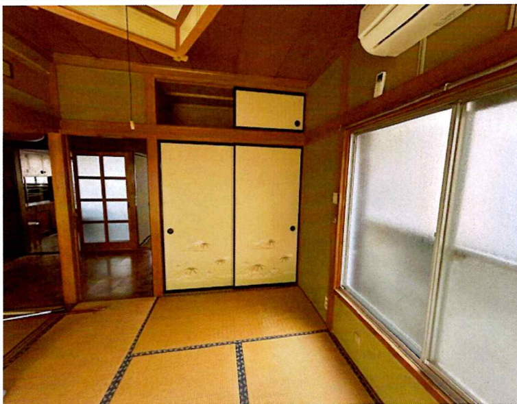
住吉2丁目2015-7 1F 南東(和室)北側方向