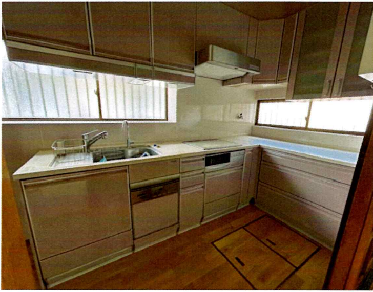
住吉2丁目2015-1 1F キッチン