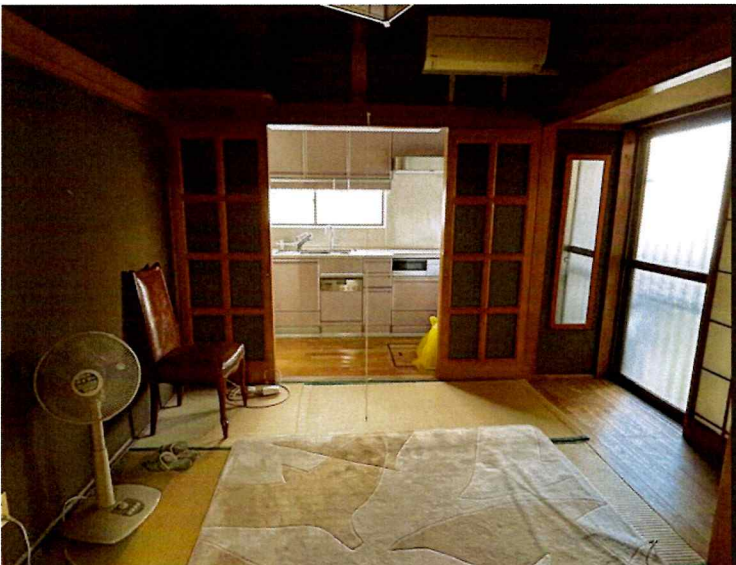
住吉2丁目2015-1 1F 北東(和室)