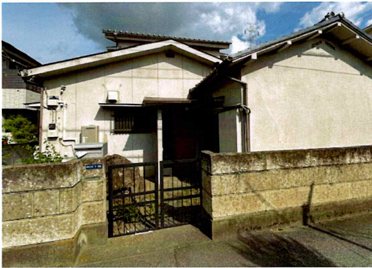
住吉2丁目2015-1 建物玄関 (外観)