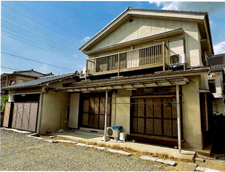
住吉2丁目2015-1 建物外観