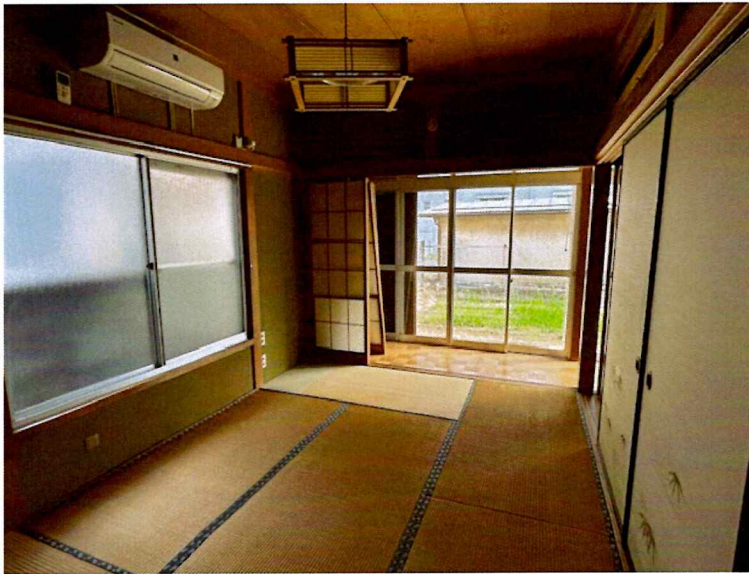
住吉2丁目2015-7 1F 南東(和室)