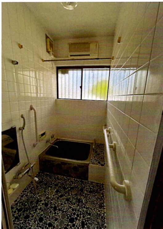
住吉2丁目2015-1 1F 浴室