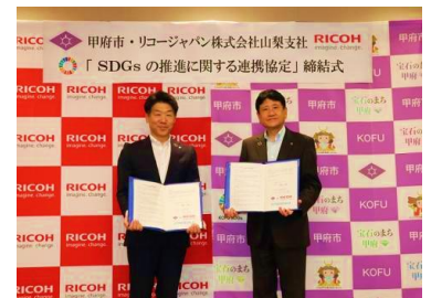
SDGsの推進に関する連携協定