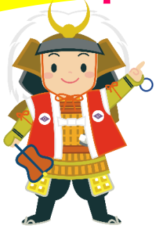
こうふPR大使 武田ハルくん

A la buena atención a los extranjeros, el Ayuntamiento de Kofu reparte panfletos en varios idiomas y un emofu pleado cualificado al idioma extranjero a disposición