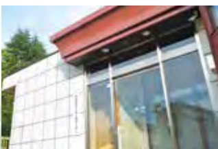
▲子ども応援センター