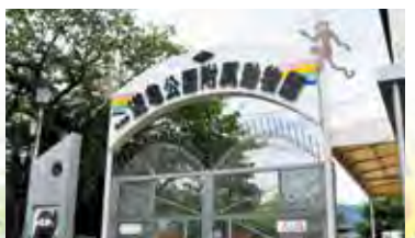
▲遊亀公園附属動物園