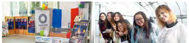
▲フランス応援ブース