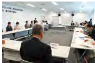
▲日本女性会議 in 甲府実行委員会設立