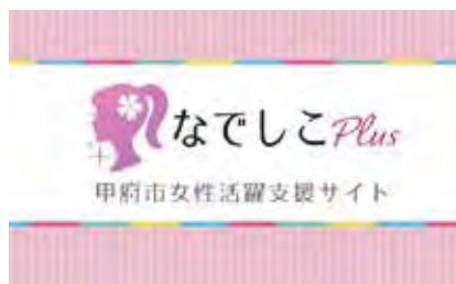
▲甲府市女性活躍支援サイト