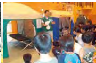
▲子ども BOUSAI 教育