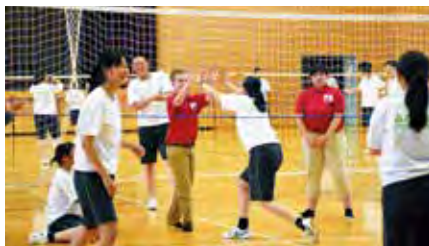
▲デモン教育派遣団授業参加