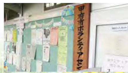
▲ボランティアセンター