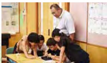
▲タブレットを利用した授業