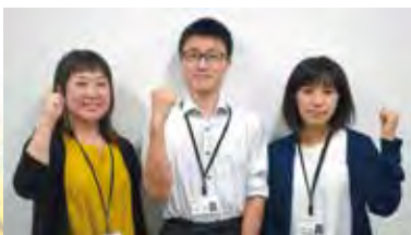
▲2019年度採用 職務経験者