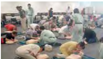
▲防災リーダー指導育成研修会