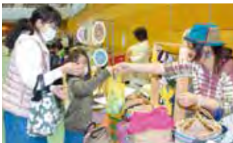
▲女性たちで創るマルシェ