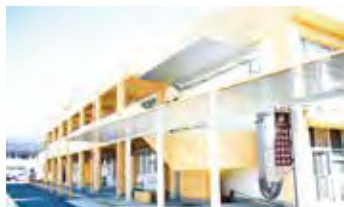
▲健康支援センター