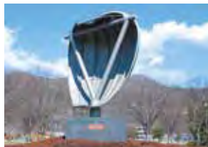
▲緑が丘スポーツ公園