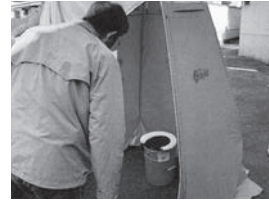
▲朝日地区西白木町 (発電機、簡易トイレ)

閩防災企画課：☎237・5331 ●防災資機材を整備 朝日地区西白木町自主防災隊、中 道地区宿自治会自主防災部がそれぞ れ防災資機材を整備しました。