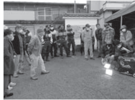
▲中道地区宿自治会 (テント、投光器)