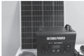
▲甲府市消防団 (ポータブルバッテリーセット 一式、ガンタイプノズル)

閩消防本部人事課：☎222・4119 ●防災資機材を整備 「消防団育成事業」として甲府市消 防団に防災資機材を整備しました。