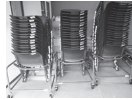
▲相川地区岩窪自治会 (会議用机、椅子、専用台車)

閩協働推進課：☎237・5298 ●コミュニティ活動の備品を整備 相川地区岩窪自治会が、コミュニ ティ活動の備品を整備しました。