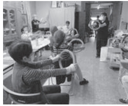
▲カラダココロづくり教室

このようなことから相生地区では、地域の健康づくりに力を入れています。各自治会、福祉推進員、地域包括支援センター、地域の介護事業所と連携して定期的に開催しているのが「カラダココロづくり」教室。地域のみなさんが集まって、椅子に座ってできる運動や、簡単脳トレ、ココロカラダチェックなどを楽しみながら行っていたり、覚えて帰ってもらうことで、自宅でもできる健康づくりを広め、高齢になっても元気で活躍できる地域づくりを推進しています。