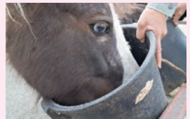
▲味噌汁を飲むポニー