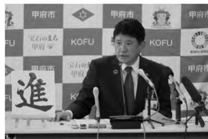
甲府市長 樋口雄一

希望ある未来に向けて進める、まちづくりへの新たな「挑戦」と「変革」 令和6年度は、長引く物価高やデジタル化、グリーン化など社会経済情勢の変化への対応をはじめ、2年目となる「NEXT ACTION」や「県央ネットやまなし」に係る取り組みの推進など、過去最大規模となる総額808億円（一般会計）の予算を編成しました。 各施策・取り組みを力強く着実に推進する中で、「第六次甲府市総合計画」に掲げる都市像の実現に向けて、全身全霊で取り組んでまいります。