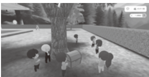
今年度実施した メタバース交流会の様子▶▶