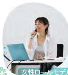
女性ロールモデルとの交流会