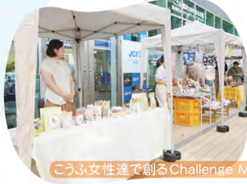
こうふ女性達で創るChallenge Market