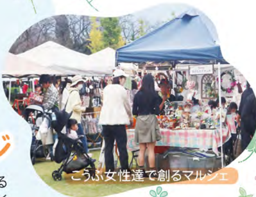
こうふ女性達で創るマルシェ