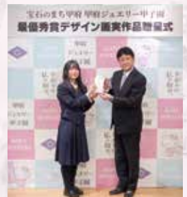
(左) 第35回甲府大好きまつり内での決勝大会 (右) 2025 最優秀賞デザイン画実作品贈呈式