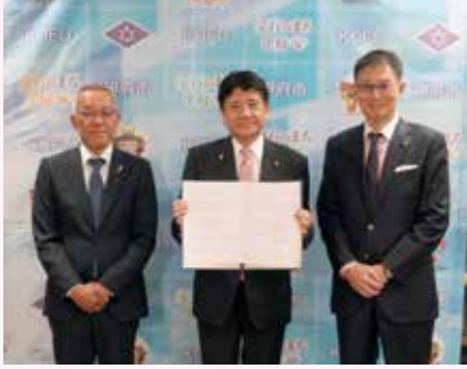
ジュエリースタート事業連携協定締結式 (3月27日)