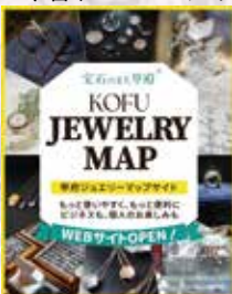
甲府ジュエリーマップサイト

今春、WEBサイトOPEN!! 個人向け、ビジネス向け検索で内容が充実! 「宝石のまち甲府」では、オーダーメイド制作、リフォーム、工房見学、宝石研磨体験、ショッピングなどジュエリーの魅力を存分に楽しめます。