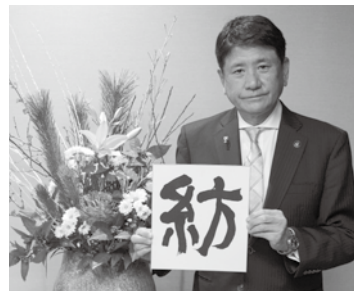
甲府市長 樋口雄一

令和8年度は「第七次甲府市総合計画」のスタートにあたり、希望ある未来を創り、次世代に自信をもって紡いでいけるまちづくりの第一歩をしっかりと踏み出していくという決意を込めて、希望ある未来に「紡ぎ・創る」更なる魅力に溢れるまちづくりへ向けて「を」をテーマとし、未来へ紡ぐ取組や社会情勢の変化を捉えた対応に係る経費など、一般会計で過去最大規模となる総額918億円の当初予算を編成しました。