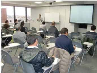
アグリビジネススクール 2019 の様子