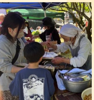
▲お子様からご年配の方まで楽しめるイベントとなりました