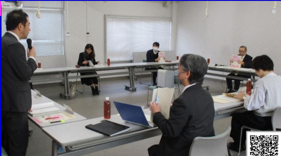
▲懇話会の様子 第4期推進行動計画はこちらから▶