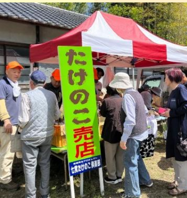
▲地域で採れたたけのこは大好評

また、運営には「たけのご倶楽部」をはじめ、消防団や女性部など様々な団体が参加し、世代を超えた協力のもと開催されました。様々な団体が連携することで、地域のつながりが深まり、次世代へ伝統文化の継承にもつながる機会となりました。