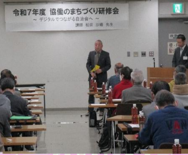
▲「協働のまちづくり研修会」の様子

令和8年2月に『令和7年度 協働のまちづくり研修会』を開催し、自治会関係者74名の皆様にご参加いただきました。