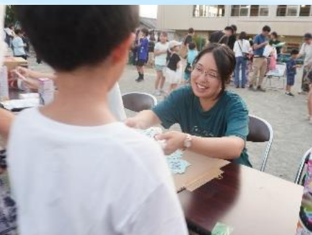
▲お祭りの受付を支援する甲斐縁隊の学生

相川地区では毎年『ふれあい夏祭り』を開催しています。今回、あつ活サポーター団体として登録している学生ボランティア団体の『甲斐縁隊』が、子ども縁日の運営を支援しました。支援内容は、縁日に来場した方々の受付業務です。この夏祭りは自治会をはじめ地域の各種団体が『協議体』を作って毎年開催していますが、運営の担い手が減ってきています。これまでと同規模での開催を維持していきたいとの地域の各種団体の意向から、昨年度に引き続き、あつ活サポーター団体登録制度を活用しました。地域からは、「担い手が少ない中で助かった」「来場した子ども達とも一緒に遊んでくれて喜ばれた」などの感想がありました。